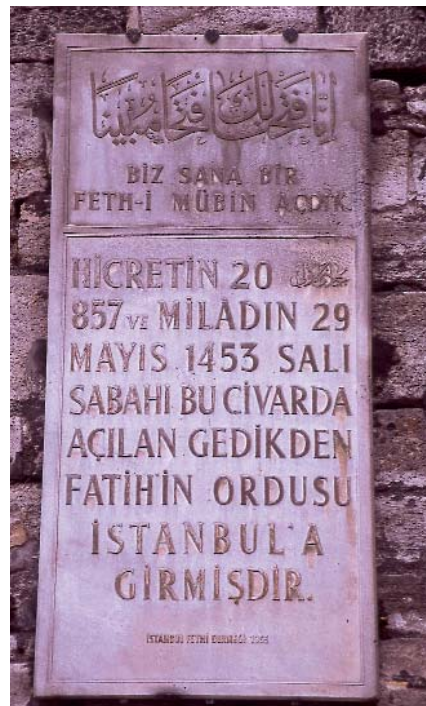
Resim 3; Edirne Kapısı genel görünümü