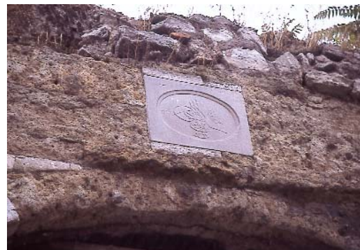
Resim 9; Cibali kapısı

bul'un değişik yerleri ile bazı sur kapılarına hattat Mâcid Ayrıl (ö. 1961) (1) hattı ve Prof. Emin Barın (ö. 1987) (2) kaligrafisi ile mermer kitabeler asılmıştır. Bu kitabeler Edirne Kapısı, Topkapı ve Cibali Kapısına asılmışlardır ki hâlen yerlerinde durmaktadırlar.