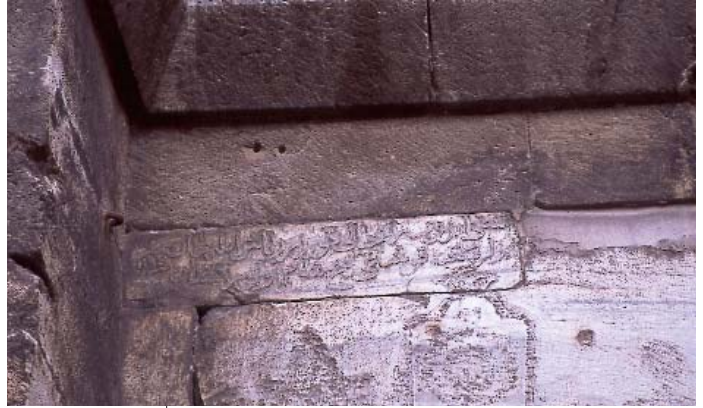
Resim 6; Edirne Kapısı kemerinde bulunan bazı yazılar

(1) Macid Ayrıl: 1891 yılında doğdu. Beylerbeyi Hamidiye Mektebi'nde okurken ilk yazı derslerini aldı. Medresetü'l-Hattâtîn'e devam etti. Tuğra-keş İsmâil Hakkı Altunbezer ve Hulusi Efendi'den yazı meşketti. Ankara'da uzun süre memurluk yaptıktan sonra, emekli oldu. Dört yıl Irak'ta yazı hocası yaptı. 17 Mart 1961 tarihinde vefat etti.