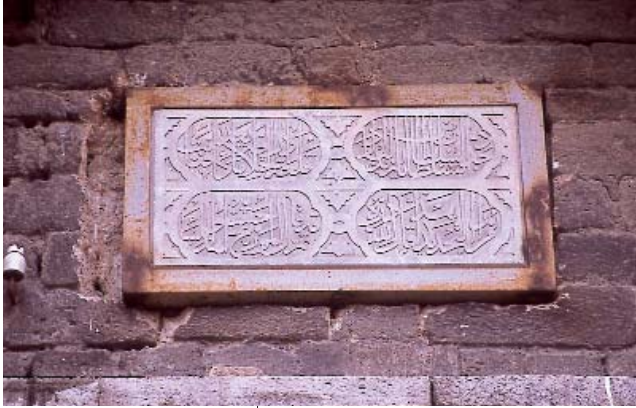
Resim 5; Edirne Kapısı'nda bulunan kitabe