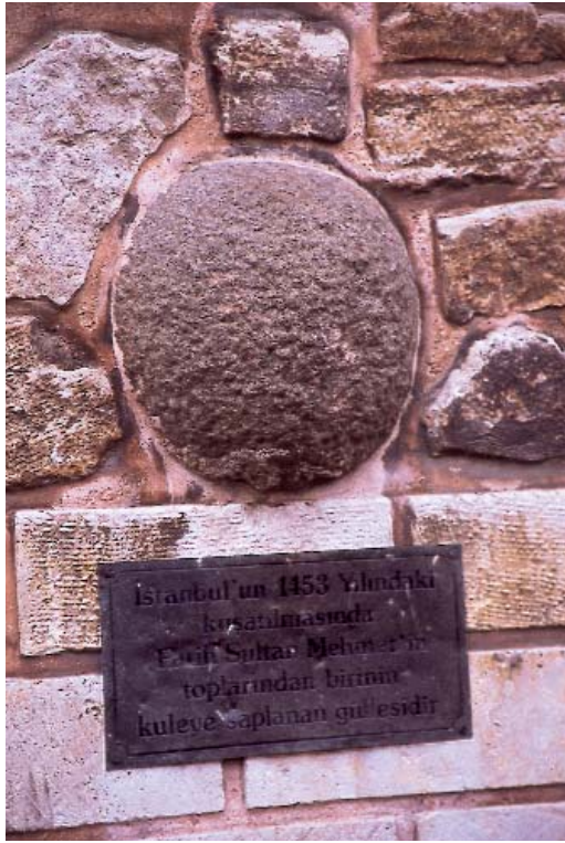
Resim 10; Ahır kapısı üzerinde bulunan kitabe

Padişâh-ı heft kişver kîm hüddâ Zât-ı pâkin masdar-ı dâd ile Yâni Sultan Ahmed âli himmet Serkeşânı emre münkâd eyledi Devr-i hükmünde cihân mamurdur Bu harâb-ı abâdî âbad eyledi Burc-ı devlette mekîn etsin hüddâ Bu duayı âlem evrâd eyledi Bâ husus istanbulun surun dahi Yapmakla halkı dîlşâd eyledi Sâdir oldu hattı vezîr-i azama Kal'a termîmini icâd eyledi Âsaf İbrahim paşadır o zât Şâh-ı âlem anı dâmad eyledi Emredib matbah emini kuluna Hizmet-i tamir ile şâd eyledi Ka'be yaptı sân-ı Halil azrı Sa'yini tâ öyle müzdâd eyledi Yalı köşküinden dernarlıya dek İki yılda reşk-i Bağdad eyledi Halk müstefnâ idi evvâbdan Her kişi bir bâb icâd eyledi Burc u bârûlar harâb olmuş iken Bî bedel tamir u biünvâd eyledi