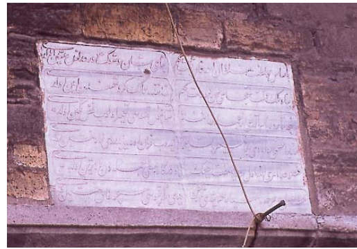
Resim 7; Yedikule kapısı üzerinde bulunan celî talik kitabe.

Bazı kapılarda bulunan, Osmanlı zamanından kalma kitabelerden başka, Fethin 500. yıldönümü münâsebetiyle 1953 yılında, İstanbul Fethi Derneği tarafından İstan-