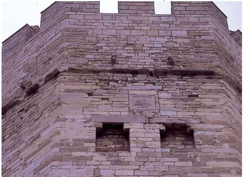
Resim 12; Üçüncü Ahmed Burcu.