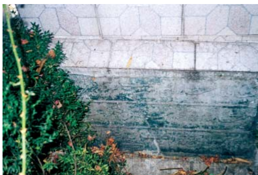
Resim 3; Hacet kitabesi