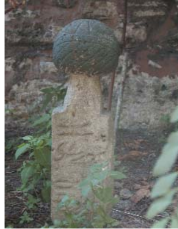
Resim 9; Şeyh Abdullah Efendi