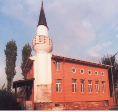
Resim 3; Yavedut Mescidi genel görünüşü