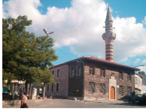
Resim 5; Fethi Çelebi Camii

Mescit, 1989 yılında temel seviyesine kadar yıktırılarak yeniden inşa ettirilmiştir. Mes-