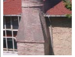
Resim 13; Sofular Mescidi