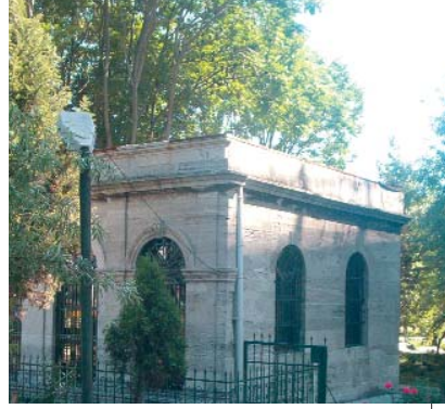
Resim 4; Yavedut türbesi