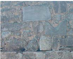
Resim 12; Fethi Çelebi Mescidi güneş saati