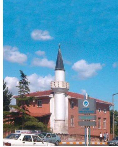
Resim 1; Eyüp Câmi-i Kebir Mahallesi