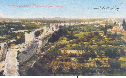
Resim 4; Kartpostallarda surlar Resim 5; Belgrad Kapı Resim 6; Üçlü sur sistemi