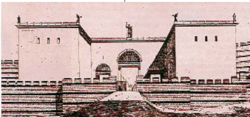
Resim 9; Altınkapı

olmayıp, içleri moloz dolguludur. Taş sıraların aralarında tuğla diziler olup, bunlar hatıl vazifesi görmektedir. Herhangi bir kuşatma esnasında duvarlara yönelik bir taarruz hareketinde