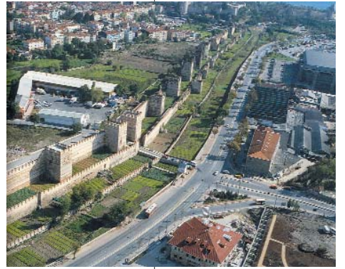
Resim 10; Gravürlerde sur Resim 11; Surların yukarıdan görünümü