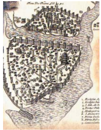
Resim 1; Bizans döneminde surlar Resim 2; İstanbul'da ilk dönemler