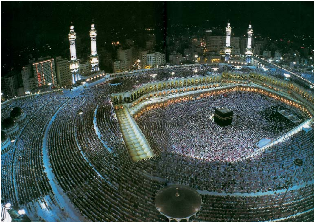
Harem-i Şerif Mekke (Yol Kültürü 9, Ocak 2001)

(6) Numaralar kitapçığın orijinalinde mevcut olduğu için aynen aldık. Olaki araştırmacıların dikkatini çeker. (yay. notu.)