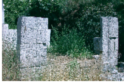
Resim 1; Çelebi Alaüddin el-Arabî Efendi Türbesinin günümüzdeki kalıntıları

Aslında Halep'li olduğu bilinen Çelebi Alaüddin el-Arabî Efendi Sultan II. Bayezid (1481-1512) döneminde 1495'den 1496'da vefatına kadar çok kısa kalmıştır. Genellikle verilen bilgilere göre bu zatın 99 çocuğu olduğu öğrenilir. Kaynakta bir yazılış hatası var mıdır? yoksa gerçekten bu zat bu kadar çocuğa sahip olmuş mudur? bunu öğrenmemiz mümkün değildir (2) . İşte Eyüp toprak-