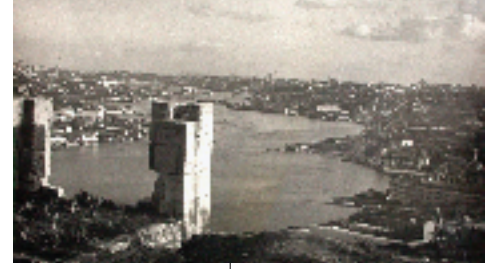
Resim 5; Türbenin Sabiha Tansuğ Hanımefendi tarafından verilmiş olan fotoğrafı