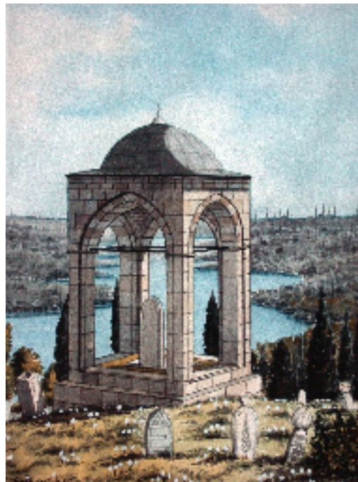
Resim 2; Türbenin A. Süheyl Ünver tarafından çizilen restitüsyonu

Türbenin orijinal mimarisiyle ne kadar süre boyunca yaşadığını bilmiyoruz. Ancak 19. yüzyılın ilk yarısı içlerinde yayınlanmış