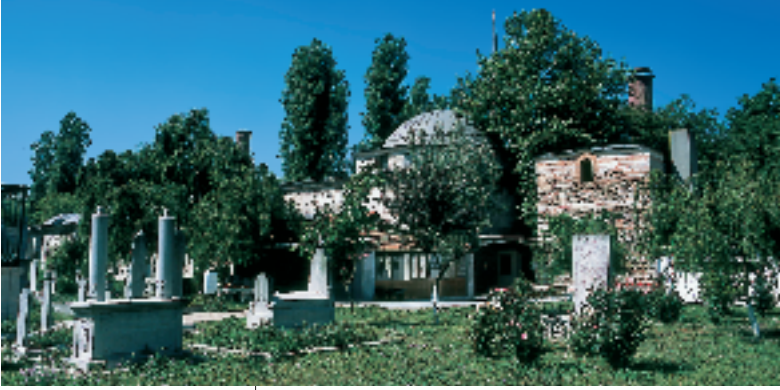
Resim 2; İmaret hazire kısmı

“ İstanbul’da Vefa Camii yanında kendi mallarından inşa ettirdikleri altlı- üstlü 60 odayı, dört büyük ahır, bir ambarı, samanlık, kömürlük, iki masura temiz suyu, 15 adet helayı, dört tarafı taş duvarla çevrili avluyu, damlalık, koridor, sokak kapısını, 20 dükkanlık büyük bir hanı,