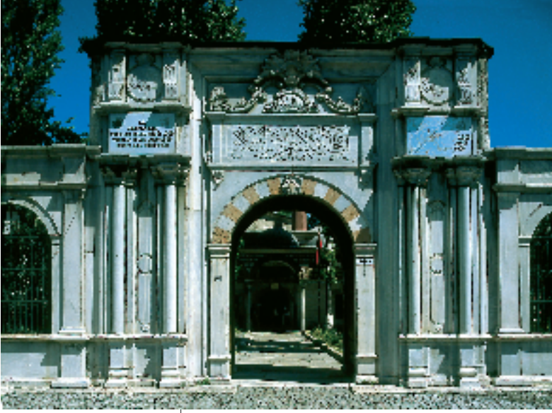
Resim 4; İmaret giriş kapısı

Ruzname kâtibi (günlük defter yazan kişi) günlük 30 akçe yolluk ve zahire bedeli olarak 787.5 kuruşla birlikte günlük üç çift ekmek ve üç mükemmel yemek alıyor. Vakfın dindar, salih, uyanık, mucit tahsildarı günlük on akçe maaş, yolluk ve zahire bedeli olarak da yıllık 360 kuruşla birlikte iki çift ekmek ve iki yemek alıyor.