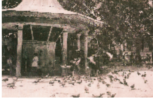
Resim 2; Eyüpsultan Şadırvanı

lüm tamamen kelâmcıların kullandığı bir dil ve mantık örgüsü içinde kaleme alınmış Allah'ın varlığına on ayrı şekilde delil getirilmiştir. 38. Bölümde, Nükabâ, Nücebâ, Kutub, Kavs gibi "ricâlü'l-gayb" hakkında bilgi verilmiştir. Eserin sonlarına doğru Pîri Şeyh Ali Berzencî'nin Kasîdetü'l-ayniye (43) şerhi'nden sık sık alıntı yaparak tercüme ettiği, açıklama getirdiği de görülür.