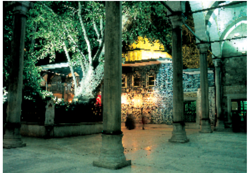
Resim 3; Eyüpsultan Türbesi

On birinci bölümde; her ehlullâhın kendi tarikatına göre farklı mesleği, meşrebine göre de takip ettiği sülûk şeklinin olabileceği vurgulanmaktadır. (60) Allah'a giden yollar mahlûkâtın adedince. Cümle yollar Rasûlüllah ile. Çünkü zikir şekillerini ashâbına o öğretmiştir. Hz. Ebu Bekir, Hz. Ali, Hz. Hasan-ı Basrî vasıtasıyla gelen bu halkalardan herhangi birine yapışan kişi yine Rasûlüllah vasıtasıyla tarîk-ı ilallâha girmiş olur.