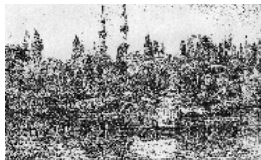
Resim 12; Flandin, Eyüp kahvehaneleri