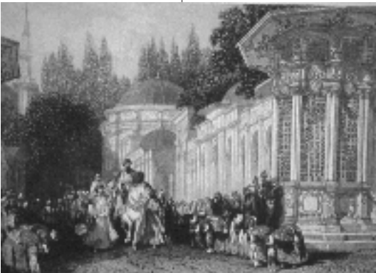
Resim 10; Allom, Mihrişah Sultan Sebili

Barlett'in Eyüp gravüründe Haliç'in İstanbul ve Eyüp kıyılarının diller şeklinde Haliç'e uzandığının ve İstanbul'u sınırlayan surlar dışında Zal Mahmut Paşa Külliyesi' nin bir dilin yükseklerinde yer aldığını, bu dilin ön tarafında ise Mihrişah Sultan İmareti' ni ve sağ tarafta iki minaresi ile Eyüp Camii' ni tespit etmek mümkün olmaktadır. 19. Yüzyılın ilk yarısı içinde bu kıyılar oldukça bâkirdir. Ancak Allom'un Gravüründe de bu boşluğun devam ettiği görül-