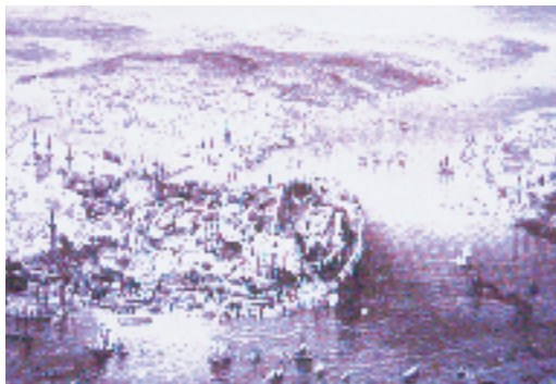
Resim 5; Méry, 1855'te İstanbul

Lorichs'in sur dışı görünütüsünde bugün için Eyüp Sultan Camii merkez alındığında hem Ayvansaray'ın hemde Eyüp'ün varoşu sayılabilecek alanda yapılaşma ile karşılaşılıyor. Malesef Lorichs'in bu paftasında yer yer tahribat var. Bu tahribata rağmen bu paftada bazı görüntüleri okuyabilmekteyiz. Ayvansaray'ın Eyüp'e çıkan kapısında kârgir yapılaşma, yuvarlak burç görülebilmektedir. Hemen bunun önünde ise çokgen bir türbe ile tek kubbeli hatta kubbeye geçişin trompla olduğu anlaşılabilir cami yapısı görülür. Bu cami etrafında büyük bir kısmı harap olmasına rağmen yapılaşmanın bulunduğu da görülmektedir. Geri plânda ise yayvan tepenin önünde vadiye açılan bir yerleşmeyi üç saç yağı şeklinde konumlanmış mescitlerle tanıyoruz. Bu mescitlerin kare planlı, oturtma çatılı olduğu anlaşılmaktadır ki, mahalle mescitlerinin bilinen özelliklerine uymaktadır. (Bu bölge atış alanı adıyla tanınan yerleşme yeri olabilir mi?) Lorichs'in müteakip paftasında coğrafik topografyanın tepe silüetlerini takip etmek veyahut görme imkânı buluyoruz. Burada önde yer alan yerleşimlerin daha engebeli bir arazide gerçekleştiği anlaşılmaktadır. Nitekim kıydan tepeye doğru baktığımızda kıyı şeridinde yer alan yer-