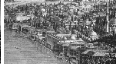
Resim 6a; Melling, İstanbul Haliç dilleri