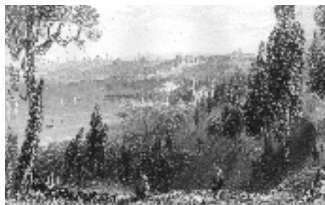
Resim 8a-8b; Bartlett, Eyüp ayrıntı