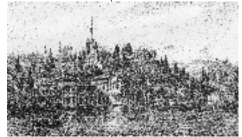
Resim 7; Melling, Küçük Esma Sultan Sarayı

çeşitli kârgir yapıları kıyının imkân verdiği konumlamayla yer almıştır. Bu yapılar daha çok dikdörtgen planlı, çift meyilli çatılı yapılardır. Bu yerleşimin solunda, gene Haliç Kıyısında çıkıntı yapan yapılaşmayla birlikte kare planlı, oturtma çatılı, minareli bir mescit, Eyüp'ün 16. yüzyıl ortalarındaki bir mahallesine işaret ederken bu mescit ile cami arasında sağda ikinci bir minareli mescit de görülmektedir. Lorichs'in Eyüp paftasındaki bir diğer önemli yapılaşma ise tam ortada yer almaktadır. Bu yapılaşma bir külliye bütünlüğünü de ifade eder biçimde konumlanmıştır. Haliç'e uzanan bir rıhtım, iki kenarı Haliç'in sularıyla çevrili bir han ve hemen arkasında merkezi kubbeli, minareli bir cami görülür. (Resim 4a, 4b) Günümüzde böyle bir yapı kütleleri Eyüp'te mevcut değildir. Peki bu külliye bütünlüğü gösteren yapılar kime ait olabilir? Lorichs'in İstanbul'un Haliç kıyılarını gösteren paftalarını incelediğimizde sadece Eminönü Rüstem Paşa Külliyesi 'nin iki hanını (Büyük ve Küçük Rüstem Paşa Hanları) görmekteyiz. Eminönü gibi önemli bir ticarî merkez olan Galata'da da (1560'lı yıllar) Rüstem Paşa Hanı , kısa bir süre sonra Galata surları içinde dikdörtgen planlı olarak inşa ettirildiğini biliyoruz. (5) Diğer taraftan Rüstem Paşa'nın Kanuni döneminin, hükümdardan sonraki en yüksek vakıf geliri olan vezirlerden olduğu, İstanbul menzillerin-