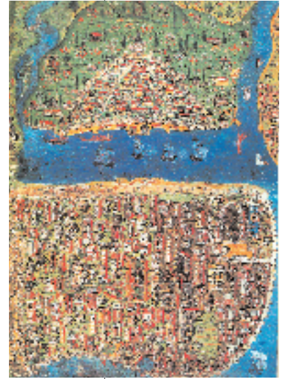
Resim 1a; Matrakçı'da Eyüp Resim 1b; Matrakçı'da İstanbul

lanmış resmidir. (1) Bu tomar sonradan kesilerek 21 levha halinde beze yapıştırılmıştır. Bu levhalarından 18, 19 ve 20. levhalar günümüz Eyüp ilçesinin Haliç'e bakan kısmıyla ilgili tarihi topografik bilgileri bize aktarıyor. Lorichs, bu eserin içinde kendi bulunduğu yeri de belirleyecek şekilde çizimlerini yaptığı anlaşılıyor. Suriçi İstanbul'unun Haliç'e bakan yüzünü görüntülerken çalıştığı yer, Pera'dan Balat'a karşı bir yerde, Galata surlarının hemen arkasındadır. Bu durum İstanbul'un tarihi yarımadasını Haliç'in su seviyesinden yaklaşık sur yüksekliğinde çizdiği anlaşılıyor. Böylece sanatçı bulunduğu yerden İstanbul'u Haliç yüzeyinden itibaren en yüksek tepelerine kadar, Haliç'e inen eğimiyle algılayabiliyor ve eserde yarımada'nın topografyası bir tarafıyla işlenmiş olarak bize yansıyor. Bu durum yarımada'nın Haliç görünüşünü bize doğru yansıtan yoruma sahip olduğunu da gösteriyor. Ancak Ayvansaray bölgesinde coğrafik topografyanın çok yükselmiş olması, bu orta çağ Bizans saray bölgesinin (Blakhernai) yapılaşmasını bulunduğu yerden detaylarıyla göremediği ve dar bir üçgen olarak yükselen yüzeyin esasen pek çok yapıya sahip olduğunu göstermeyi amaçladığı için, bu bölgeyi başka bir noktadan