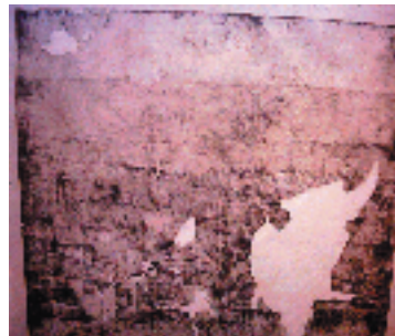
Resim 2a; M. Lorichs (Lev.18) Resim 2b; M. Lorichs (Lev.17)