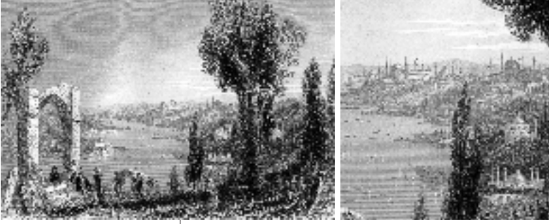
Resim 9a; Bartlett, Eyüp Mezarlığı