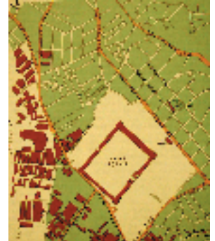
Resim-1 Eyüp Senti ve yakın çevresini gösterir harita