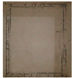
Resim-3 Rami Kışlası planı