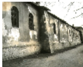
Resim-5 a,b, Rami Kışla Caddesi, Koğuş odaları (2004)