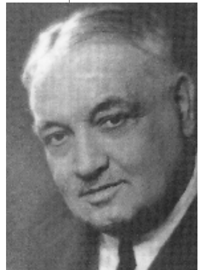
Resim 3; Yahya Kemal