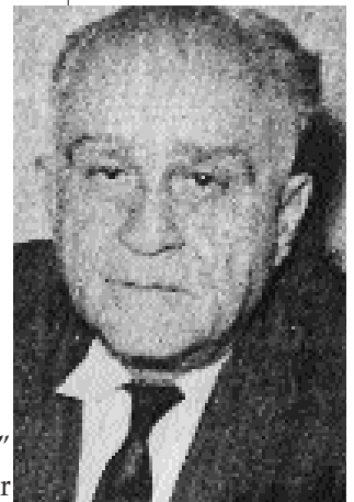
Resim 4; Ahmet Hamdi Tanpınar