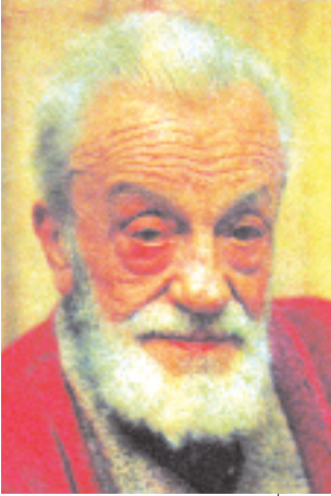
Resim 5; Necip Fazıl Kısakürek

Eski İstanbul'u çok iyi tanıyan ve anlatan yazarlarımızdan biri de Osman Cemal Kaygılı 'dır kuşkusuz. "Köşe Bucak İstanbul" onun selis bir üslup ve akıcı bir dille kaleme aldığı yazılardan oluşuyor. Yazı ve eserlerinde âdetâ İstanbul'un fotoğrafını çıkaran Kaygılı, "Eyüp Hâlâ O Eyüp, Fakat İnsanları Değişmiş" başlıklı yazısında gelişim ve değişim içindeki semtin eski ve yeni durumunu mukayese ederken büyük bir hüznün dalgasına kapılır: