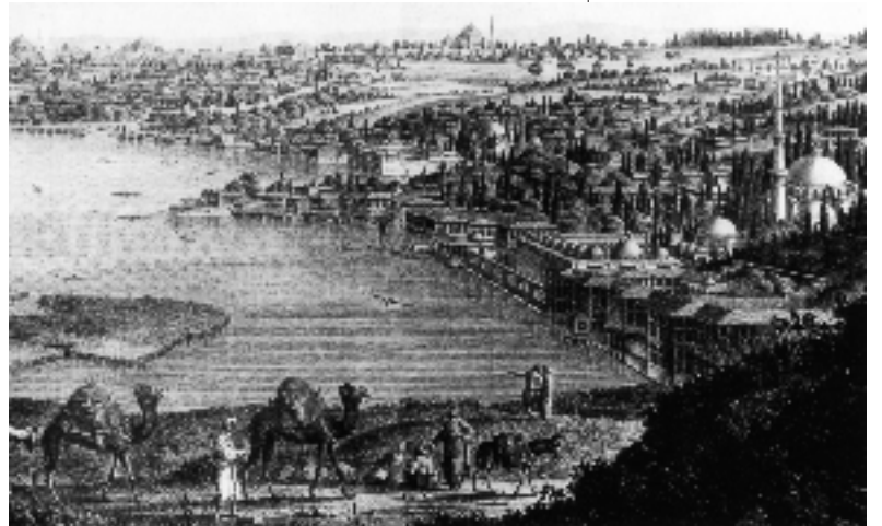
Resim 1; Eyüp gravürü, Mellin

Bilindiği gibi toplumsal yapının en önem-