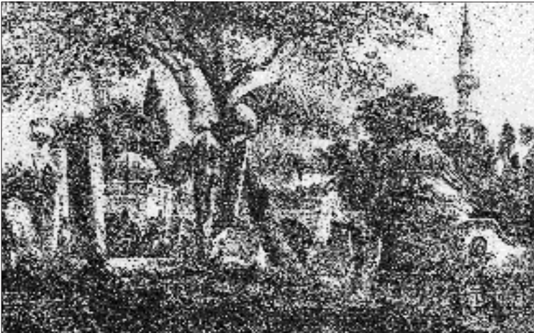
Resim 2; Eyüpsultan Flan-din,L'orient

İstanbul'a gelip Eyüb'e uğrayan gezginlerden birisi olan, Edmondo De Amicis şu satırları yazmaktadır; "Eyüp mezarlığı nasıl unutulur. Oraya bir akşam grup vaktinde gittik ve hafızamda hep o gün gördüğüm gibi güneşin son ışıklarıyla aydınlanmış olarak kaldı. Hafif bir kayık bizi Haliç'in nihâyetine götürdü. Ve Osmanlıların mukaddes toprağına, yani iki yanı kâbirlerle çevrilmiş pek meylli bu yoldan çıktık. Bu saatte bütün gün mezarlarda çalışan ve büyük kabristanı çekiş sesiyle dolduran taş yontucuları bırakıp gitmişlerdi. Ortalık sessizdi. Bu fevkalâde bir sessizliğe gömülmüş, aristokratik bir mahalle gibi uhrevî bir hüznle beraber dünyevî bir hürmet hissini ilhâm eden bembeyaz gölgeli ve şahâne güzelliğe sahip bir mezar şehridir. Mezarlık bahçelerindeki yeşilliğin çelenkler