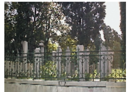
Resim 11; Aile mezarlığı