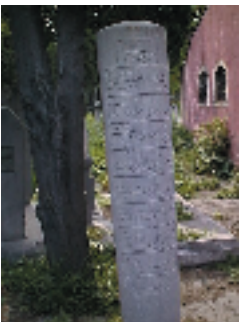
Resim 9; Aliye Hanım'ın erkek kardeşi Mehmed Ebulhayr Efendi'nin mezar taşından bir başka görünüm