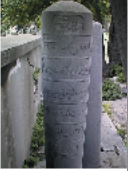
Resim 6; Aliye Molla Hanım'ın istinsah ettiği 'İlm-i Ledünni Risalesi Tercümesi' isimli kkitabın yazarı Gevrekzade Hafız Hasan Efendi'nin mezar taşı