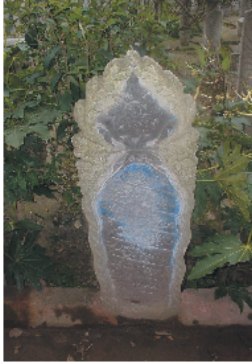
Resim 1; Osmanlı Dönemi Kadın Mezar taşlarından bir örnek

Bu çalışmada sunacağımız Ahmedi Can'a ait mezartaşı bu mezartaşlarından farklı olarak ilk kez tanıtılmaktadır.