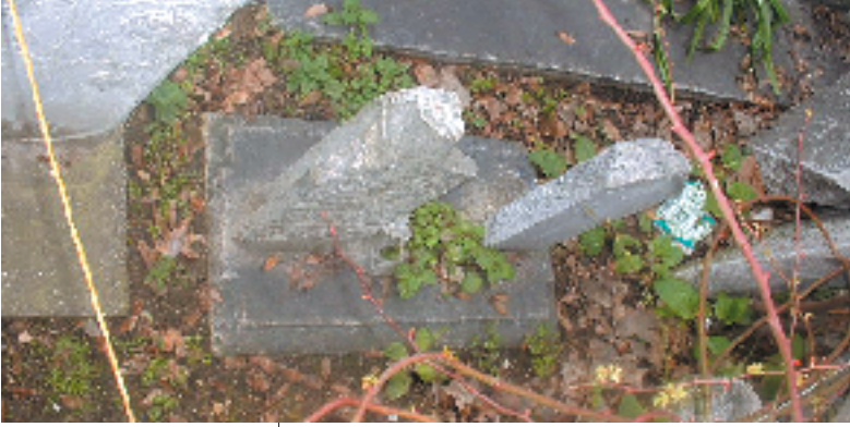
Resim 3; Osmanlı Dönemi Çocuk Mezar taşlarından bir örnek

gelen Karasuk kültürü (M.Ö. 1200-700)'nden kaldığı düşünülen mezar heykelleri bulunmuştur fakat son zamanlarda bu mezar heykellerinin Afanasyevodan sonra doğudan gelmiş farklı bir kültür oluşturan Okunev kültürüne ait olduğu ortaya çıkarılmıştır. Bu steller üzerine yarı insan yarı hayvan biçimli mask kabartmaları bulunur. İki örnekte, stelin tepesine bir koç başı heykeli yontulmuştur. Bu unsur islamiyetten sonra Ak ve Karakoyunlu devletlerinin mezar taşarına kadar devam edecektir. Okunev kültüründe görülen mezar taşları bir işaret niteliği taşımaktadır. Mezarların yeri belli eden bu taşlar Türk inaçlarından en önemlisi atalar kültüründe oluştuğunu göstermektedir. Karasuk kültüründe Okunev kültüründen devam eden bir usul doğdu. M.Ö. 700-100 arasına tarihlenen Güney Sibirya kültürlerinden Tagar Kültüründe kurganların yakınında gayet büyük taşlar dikilmişti (3) . Bu taşların üzerine geyik figürleri çiziliyordu. Geyik figürleri ölümsüzlüğü temsil ediyor ve mezarda yatanı cennete ulaştıracak taşıt olarak ta görülüyordu (4) . Geyik figürleri genelde soğuk bölgeler için geçerliydi. Bu bölgeler de ulaşım sadece geyikle yapıyordu. Güney bölgelerde ise bu görevi at üstlenmişti. Pazırık kurganlarından çıkarılan geyik masklı atlarda bu konu ile ilişkilidir.