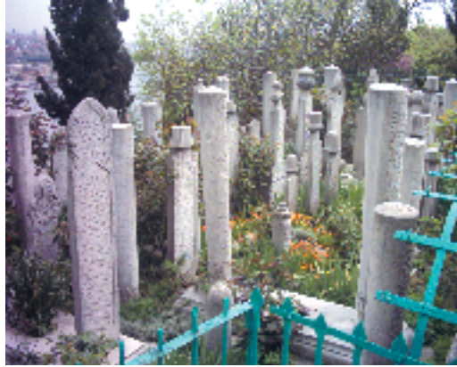
Resim 4; Osmanlı Dönemi Mezar taşlarından genel bir görünüş

Erken dönem Bursa Osmanlı mezar taşları da aynı özellikleri göstermekle birlikte birbirinden ayrı unsurlara da sahiptir. Hen-