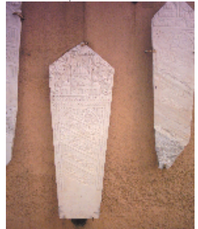
Resim 5; Osmanlı Dönemi batı Anadolu cami tasvirli mezar taşlarından bir örnek

Mezar taşları kendi içerisinde farklılıklar göstermektedir. En belirgin özellik olarak kadın ve erkek mezar taşlarıdır. (17) Kadın mezar taşları daha çok kavuksuz yapılırken erkek mezar taşları kavuklu yer almaktadır. Kadın mezar taşları daha süslü, bol çiçekli olarak ele alınırken erkek mezar taşları sade bırakılmaktadır. Erkek mezar taşlarında birçok kavuk