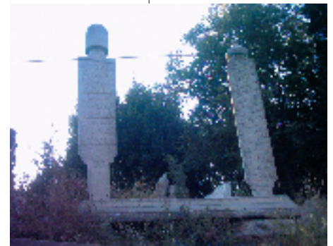
Resim 2; Osmanlı Dönemi Erkek Mezar taşlarından bir örnek