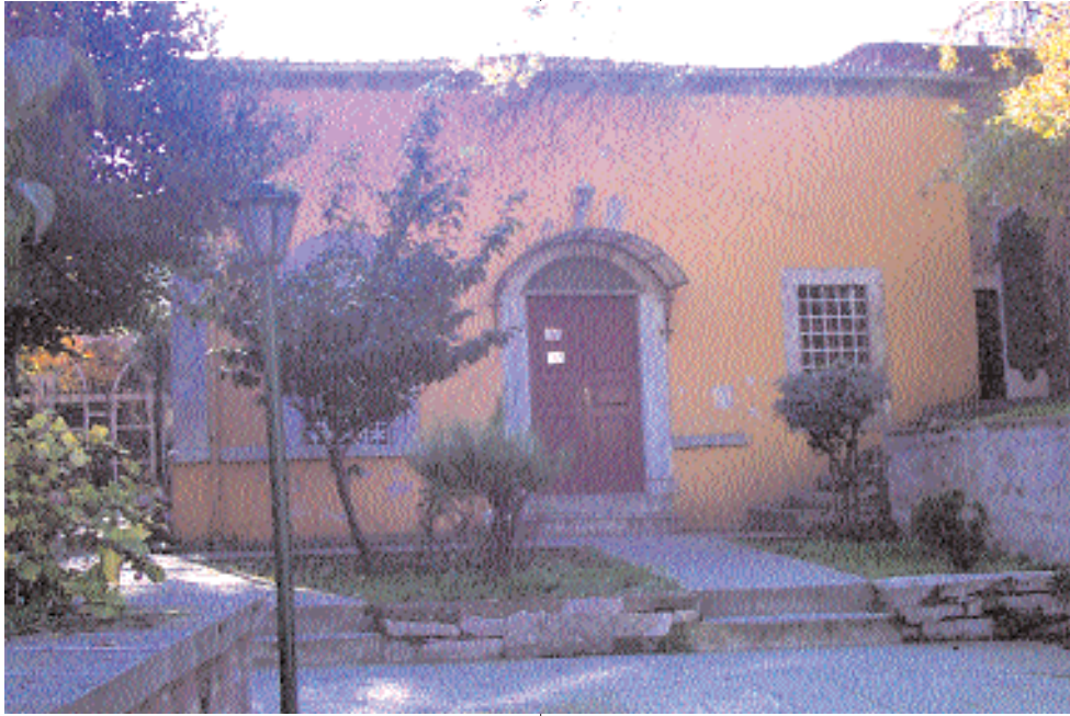
Resim 1: Eyüp Otakçılar'ı da Şeyh Murad Buhârî Tekkesi

Tebliğimizin konusu olan Lâ'lîzâde Abdülbâki Efendi'nin mensubu olduğu Bayrami Melâmîliğinin kökenleri, VIII. yüzyılın sonlarında Horasan'da ortaya çıkan ve IX. yüzyıldan itibaren Nişabur merkez olmak üzere Merv, Herat ve Belh gibi Irak şehirlerindeki esnaf zümreleri arasında yayılan, cezbeye ağırlık veren ve adına Melâmetîlik denilen tasavvuf akımına dayanır. Bu akımın kurucusu olarak Hamdun el-Kassâr kabul edilir.