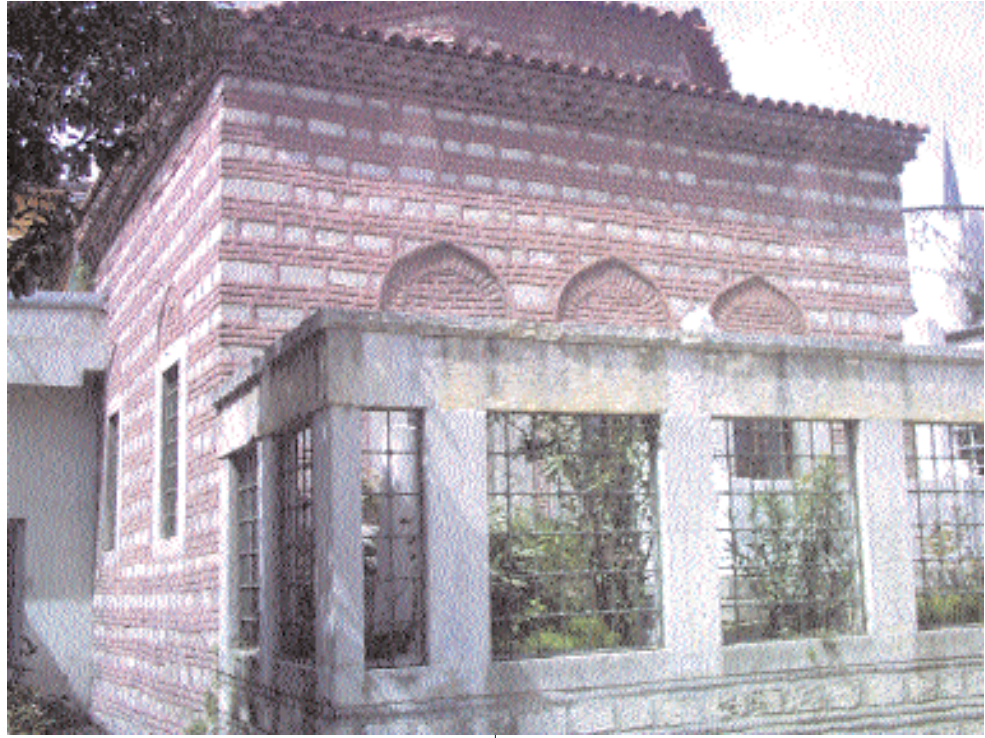
Resim 2: Kalenderhâne Tekkesi

Yaşı küçük olduğu için halk arasında Oğlan Şeyh adıyla tanınan İsmail Maşûki, rivayete göre, engin bir dini bilgiye sahiptir. İstanbul'a geldikten sonra kısa süre içerisinde oldukça fazla sayıda taraftar toplamış, tarikatı, şehirli esnaf ve tüccarlar ile askerler arasında da yaymayı başarmıştır 3 . Henüz on dokuz yaşında olmasına rağmen, özellikle Ayasofya ve Süleymaniye Camilerinde verdiği vaazlar neticesinde onun bu kadar fazla mürid toplaması ve Vahdet-i Vücutçu anlayışı öne çıkarak aşırı cezbeli yaşantısı, kısa süre sonra babası gibi mehdilik iddiasında bulunduğu şikayetleri üzerine yapılan tahkikat sonucunda Şeyhülislam Çivizade Muhyiddin Mehmed Efendi'nin fetvasıyla 4 1528 yılında henüz yirmi bir yaşında iken on iki müridiyle birlikte öldürülmesiyle sonuçlanmıştır.