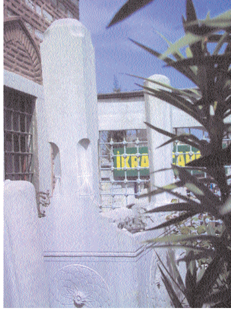
Resim 5: Abdülbâki Efendi'nin mezarının başka bir açıdan görünüşü

hülislam Sun'izâde Seyyid Mehmed Emin Efendi'nin alelacele verdiği fetva uyarınca doksan yaşını aşmış olduğu halde Fenerbahçe koyunda boğularak idam edildikten sonra cesedi denize atılmıştır. Sütçü Beşir Ağa, R. Kılıç'ın ifadesiyle, Melâmîlerin Osmanlı yönetimi tarafından idam edilen son şehidleri olmuştur 10 .