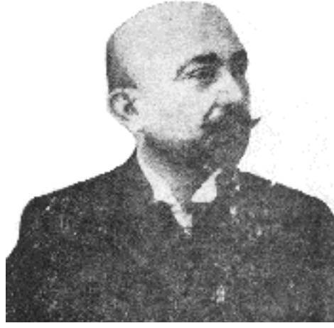
Damat Mahmud Celaleddin Paşa

bir şekilde ele alıp, sebep-netice zinciri içinde değerlendirir.