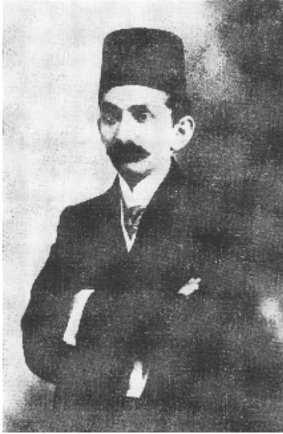
Damat Mahmud Celaeddin Paşa'nın oğlu Prens Selahattin

şaha son derece ağır bir dille eleştiriler yönelten hakaret-âmiz mektuplar gönderir. Paşa, Le Matine gazetesinde yayımlanan bir makalede adalete ve halka hürriyet, gazetelerin sansürsüz olması, Avrupa'dan İstanbul'a serbestçe gazete ve kitap girebilmesi, 2000 civarındaki siyasî suçlunun serbest bırakılması, demiryollarının inşası, halka eğitim imkânı verilmesi gibi talepler sıralar ve bu talepler, gerçekleştiği takdirde geri dönebileceğini söyler. Paşa'nın, bu istekleriyle kendisine geri döndürmeye çalışan farklı araçlara ve basına yönelttiği taleplerinin uyuşmadığını söyleyebiliriz.