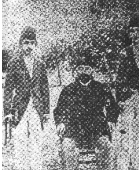
Damat Mahmud Celaleddin Paşa oğullarıyla

Bilindiği üzere 1860'larda Namık Kemal, Ziya Paşa, Ali Suavi, Mustafa Fazıl Paşa gibi isimler meşrutiyet idaresini kurmak maksadıyla yeni Osmanlılar cemiyeti adıyla bir hareket başlatırlar. 1889'da Askeri Tıbbiy'e de İttihadî Osmanî adıyla bir teşkilât kurulur. İbrahim Temo, İshak Sü-kûtî, Mehmed Reşit, Apdullah Cevdet, Hüseyinzade Ali bu teşkilâtın üyeleridir. Kendilerine Jön Türkler denilen bu teşkilat üyeleri II. Abdülhamid'i tahttan indirme amacını taşırlar. 1895'te Paris'e gelen Ahmet Rıza, Meşveret gazetesini çıkarmaya başlar. Teşkilâtın adı İttihad ve Terakki olarak değişir. Bu grubun önde gelen isimlerinden biri olan Mizancı Murad, sırasıyla Paris'e, Londra'ya ve Mısır'a ve tekrar Paris'e gider ve İttihad ve Terakki'nin lideri olur. Cemiyet Türkçe Mizan ve Türkçe Meşveret gazetesini çıkarır. Jön-