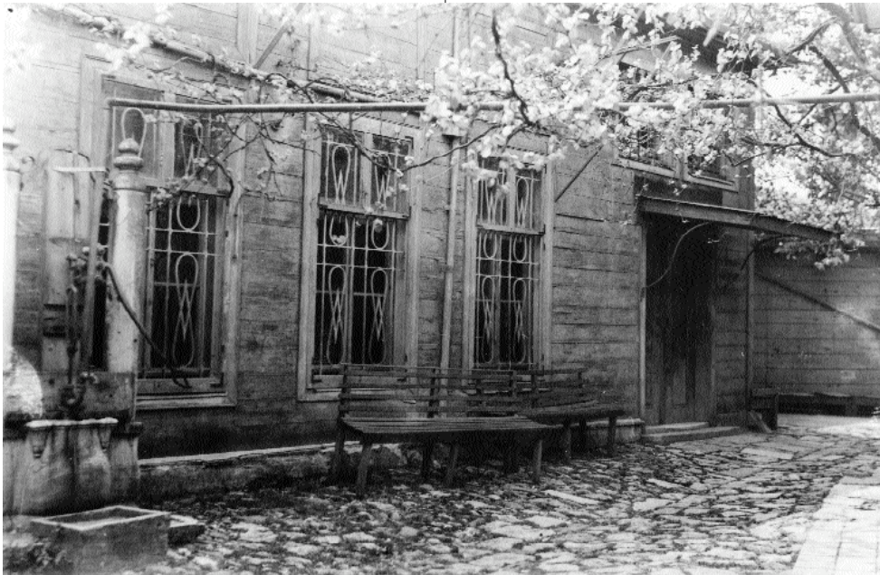
Kaşgari Camii'nin dış görünüşü.

Bir gün vapurda karşılaştığı, sıradan görünen bir insanın onun dikkatini çekerek Abdülhakim Arvâsi'den söz etmesi ve onu Ağa Camii'ne göndermesi elbette tesadüfi değildir. Necip Fazıl'ın Abidin Dino ile buraya bir Cuma günü gidip ilerde "kapılanacağı zât"ı görmesi ve bizzat Efendi Hazretleri tarafından Eyüp sırtlarında, Pi-