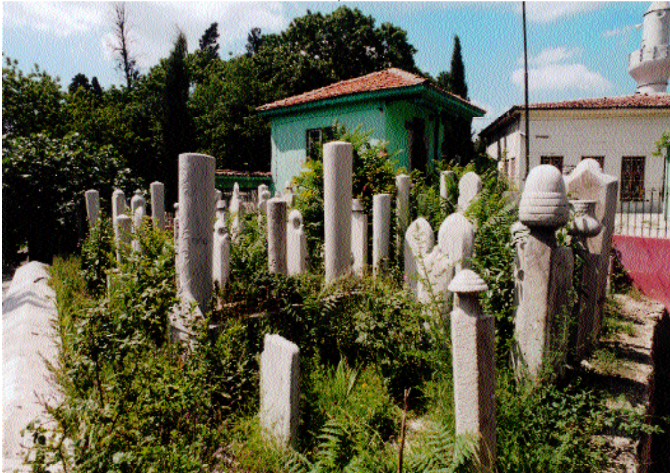
Kaşgari Tekkesi ve hazire

Tasavvufun yaşayış ve kültür olarak bizim edebiyatımıza girebildiği kadar başka bir edebiyata girebildiği söylenemez. Çünkü bizim Anadolu'da olduğu kadar Orta Asya'da da mistik olgulara karşı millet olarak ortak tavırlarımız vardır ve bunlar hep korunur. O yüzden mistik duygulanımlara ilgisiz ve tasavvufi değerlere hoyrat tavırlı olanlara karşı da bu milletin büyük bir kesimi mesafeli davranır. Yani bu millete göre akılcı olmak da o kadar akıllı bir şey değildir. Mutasavvıflara göre, bazen akılı ve dünyayı da aşk için terk et-