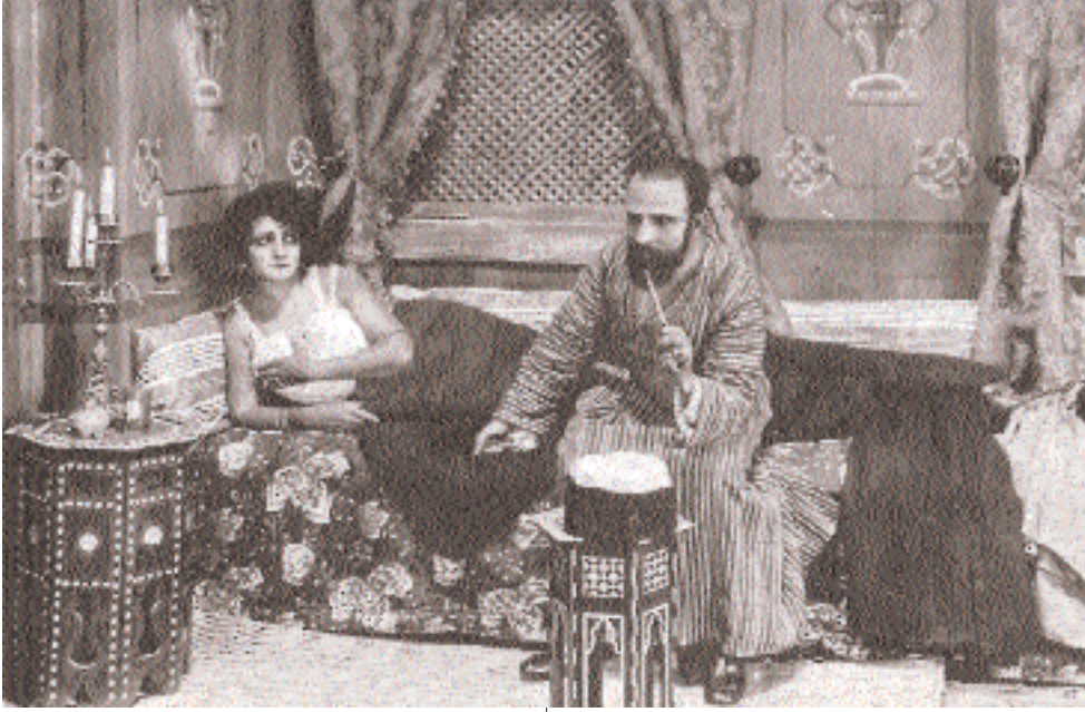
Boğaziçi Esrarı (Nur Baba) 1922, Sarmatova, Emin Belig

kılarak yok edilmiştir. İkinci olay da yine bu stüdyo ile ilgilidir.