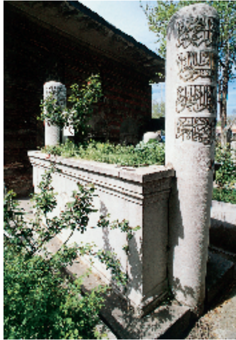
Şeyhülislam Ebussuûd Efendi'nin kabri

anlaşılmaktadır. Han ise Ulu Caminin doğusundaki Kasaplar Hali olmalıdır. Burası daha sonra Hacı Ali tarafından yaptırdığı çeşmeler için vakf edildiğinden çeşmelerle birlikte belediyeye devredilmiştir. 17