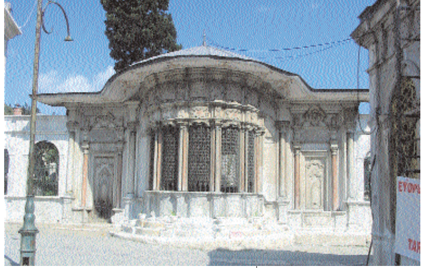
Mihrişah Valide Sultan Sebili