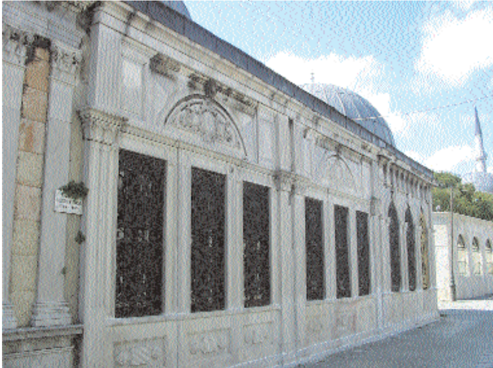
Hüseyin Paşa Kütüphanesi