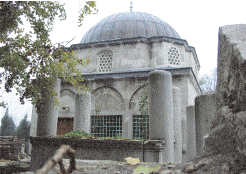
Hoca Sadettin Efendi'nin kabri

raflarının Bezmialem Sultan tarafından karşılandığı yazıyor. Ve yaptırdığı okulun bahçesinde yatan bir eğitim neferini daha selamlayarak oradan da ayrılıyorum.