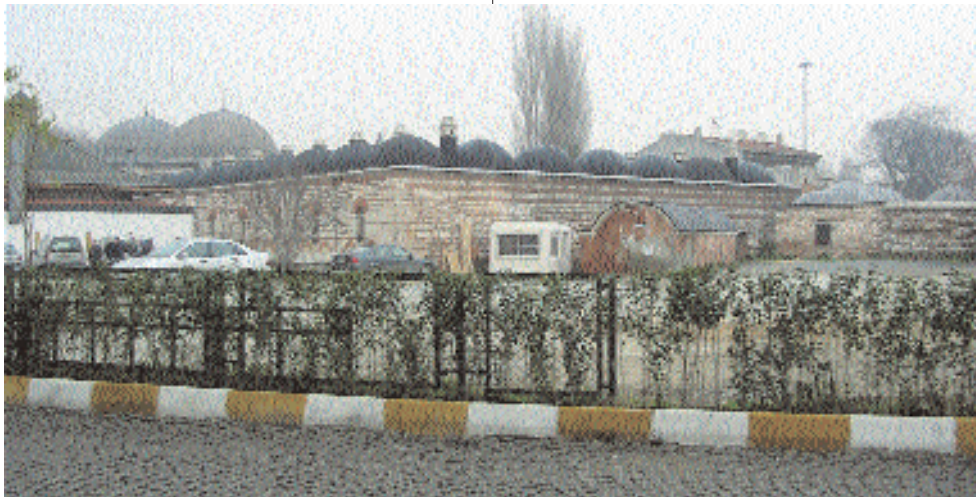
Sokullu Mehmet Paşa Medresesi

Daha fazla duramıyorum dört duvar arasında. Kaçarcasına uzaklaşıyorum tarih kitaplarımdan yanından ve sokağa atıyorum kendimi. Araba gürültüleri, insan kalabalıkları daha bir sıkıyor içimi. Kafamdaki soruların cevaplarını bulamamanın sıkıntısıyla başımı dinleyecek bir yer arıyorum kendime. Hızlı adımlarla uzaklaşıyorum kalabalıklardan. Başımı kaldırıp etrafıma