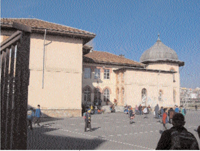
Sultan Mehmet Reşad'ın yaptırdığı Mektep

Han, sağlığında bu okulu yaptırarak adını Reşadiye Numune Mektebi koydurmuş ve devletin diğer okullarına örnek olsun diye düşünmüş. Okulun tüm masraflarını da kendisi üzerine almış. İyi de neden bu mezarlığa ve türbesinin hemen yanına diye düşünüyorsanız, Mehmet Reşad'ın vasiyetine kulak verin derim. Türbesini bu okulun bahçesine yaptırırken yanındakilere şöyle demiş yaşlı padişah; "Ben çocukları