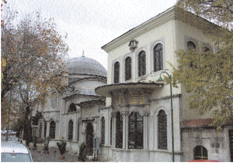
Şah Sultan Türbesi ve Mektebi