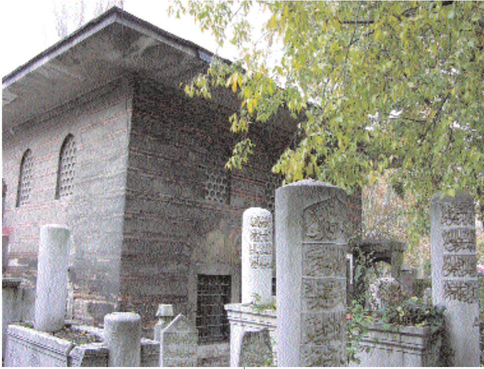
Şeyhülislamlık Ebu's-sud Efendi Sıbyan Mektebi ve kabri

Ağır ağır kaldırıyorum başımı saatlerdir okuduğum tarih kitabından. Ne büyük insanlarmış, ne de güzel işler başarmışlar. Dünyayı yönetirken çevrelerine ilim irfan saçmış, doğrudan ve erdemde hep öncü olmuşlar. Peki ya şimdi bu güzel insanların torunları olan bizler neden böyle olamıyoruz. Nedir bu pejmürdeliğimiz, ilim ve terbiye yoksunluğumuz. Nerede kaldı o büyük medeniyet ve bizim fukaralığımız. Az önce binbir düşünce içinde yükselen başım yeniden omuzlarımdan önüne düşüyor. Onları bu kadar yüce yapan şey neydi?