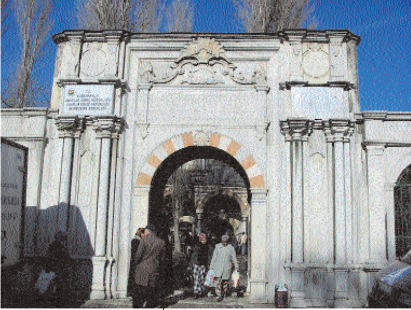
Mihrişah Valide Sultan İmaret giriş kapısı

yapılar zincirinde buluyorum kendimi. Evet gerçekten de muhteşem binalar, inanılmaz büyüklükte ve sağlamlıktalar. Fakat hiçbiri de padişahların kendi şahısları için yapılmamışlar. Dev camileri merkezine alan bu yapılarda insanlığın faydasına ne ararsanız görebiliyorsunuz. İlim adına en küçük kurum olan Sıbyan Mekteplerinden en yüksek kurum olan Medreselere, kütüphanelerden, kervansaraylara, imaretler, hamam, Darü'l-kurra, Darü'l-hadis, tabhane, sebil, çeşme ve daha neler neler. Tabi her külliye'nin kalbinde de orayı yaptıranın türbesi.