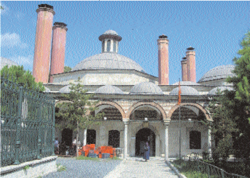
Mihrişah Valide Sultan İmaret

Bu hayırsever padişahlardan birkaçını ziyaret etmek istiyordum. İşte İstanbul'un şanlı Fatih'i ve O'nun bize armağanı olan büyük Fatih Külliyesi. İşte ilme ve irfana verilen önemin sembolü yapılar dizisi. Dev külliye'nin tam ortasında her şeyin Allah Rızası için yapıldığını anlatan muhteşem bir cami. Caminin yanında yüksek bir kütüphane ve ikisinin arasında Fatih Sultan Mehmet'in türbesi. Ve bu üçlüyü sağdan ve soldan çeviren, Akdeniz ve Karadeniz Medreseleri olarak adlandırılan sekiz adet dev fakülte binası.