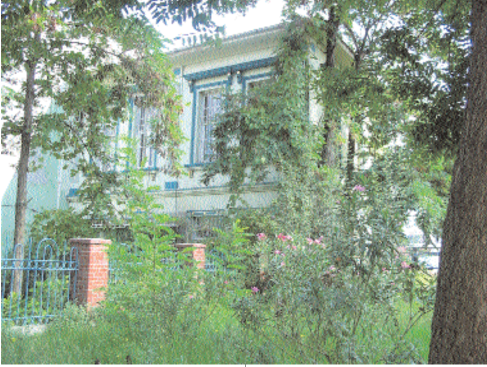
Kaptan-ı Derya Hasan Hüsnü Paşa Kütüphanesi

kapıdan geçerek içeriye girdiğimde avlu içinde, başka yapılar da dikkatimi çekiyor. Türbenin iki köşesinde iki ayrı bina. Hele bir tanesi çevresindeki yirmiye yakın kubbeli odası ile ilerilere doğru uzanıyor. Bunlar Sokullu Mehmet Paşa'nın hayatta iken yaptırdığı Medrese ve Darü'l-kurra binaları. Peki Sokullu Mehmet Paşa neden İstanbul'da bulunan ve kendisinin yaptırdığı iki büyük camiden birinin bahçesinde değil de burada yatmayı istemiş ve Mimar Sinan'a türbesini buraya yaptırmıştı.