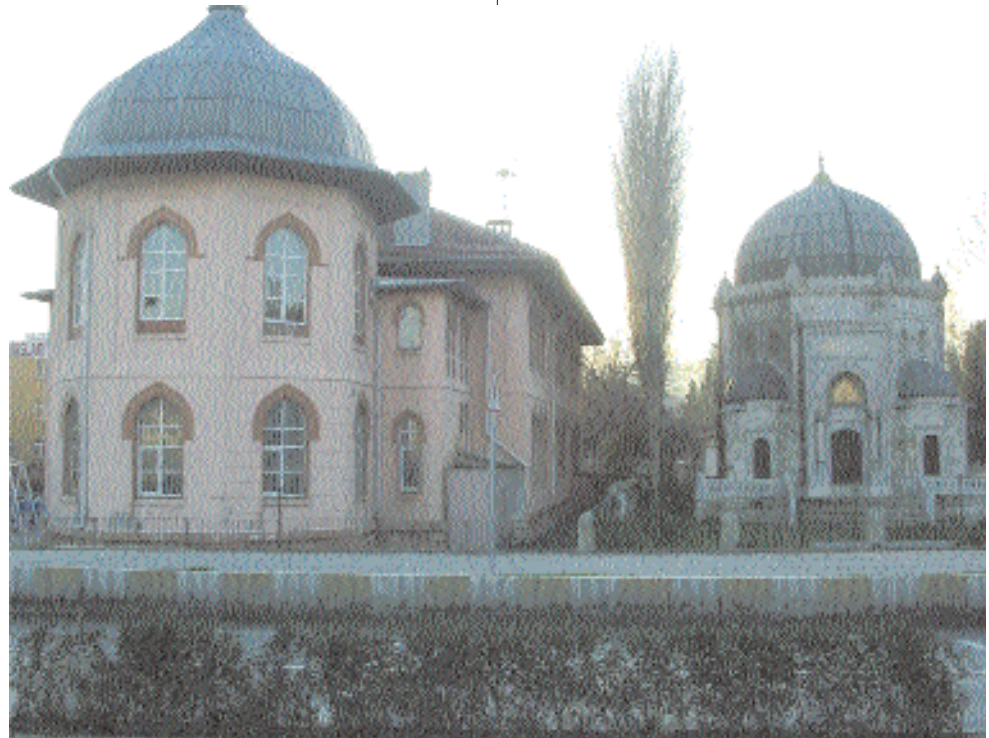
Sultan Mehmet Reşad'ın hayatta iken yaptırdığı Mektep ve türbesi

Eğitime gönül vermiş bu yiğit insanların eserlerinin şahsında artık bir mezarlıkta gezmediğimin farkındayım. Buraya sadece bir Eyüp Mezarlığı deyip geçmenin