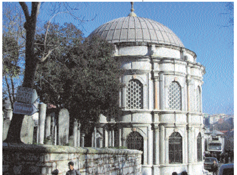
Mihrişah Valide Sultan Türbesi

Paşaları ve kadınefendileriyle eğitime canla başla sarılmış olan bu güzel teb'anın padişahını düşünüyorum birden. Bunlar yüzyıllarca dünyaya hükmetmişler. Yığın yığın altın ve mücevhere sahip olmuşlar, devasa sarayları, yüksek yüksek, ihtişamlı şatoları olmalı derken, şimdiye kadar gör-düklerimin kat kat daha büyüğü devasa