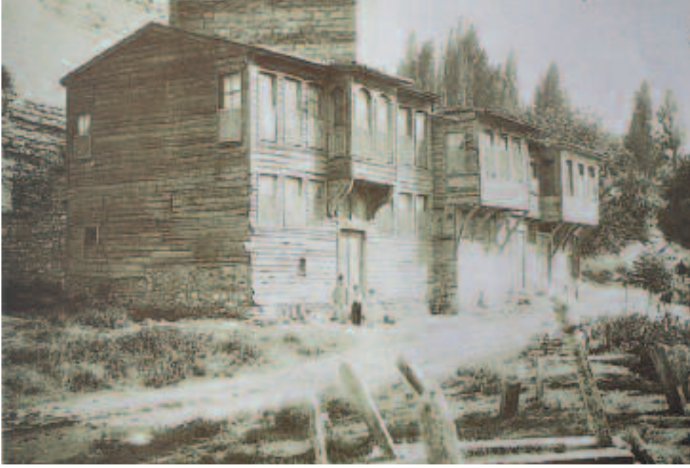
Resim10: Ayvansaray dışında surların önünde bir sokak

olan ve kendisine karşı çıkanları da zindanlara kapatmak suretiyle cezalandıran İoannes Apokaukos'un gazabına uğrayanların kapatıldıkları yer burası olabilir ve kaynaklardan bilindiğine göre de bu güçlü entrikacı kapattığı kişileri görmek üzere girdiği zindanda onlar tarafından linç edilmek suretiyle öldürülmüştür. Bu kanlı olayın yerinin burası olması kuvvetle muhtemeldir. Eyüp'ten bakıldığında bugün bu Anemas zindanı denilen yerin dış duvarının mazgalları fark edilir. 16. yüzyılda buranın üstünün bir teras halinde olduğu ve hatta burada ağaçlar olduğu da bir resimde görülmektedir. Bu zindan olarak kabul edilen alt yapının Eyüp'e bakan köşesinde ise dışarıya taşkın birbirine bitişik iki burç bulunmaktadır. Bunlara da birtakım isimler verilir. Bunların ne dereceye kadar gerçek olduklarına inanmak biraz zordur. Ancak şunu belirtmek yerinde olur ki bu burçlardan bir tanesinin en üst katında buradaki Blakhernai sarayının bir bölümü olarak kullanılmıştır. Eski sütun gövdelerinden oluşan bir dizi konsolun ka-