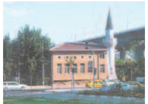
Resim4: Yavedud Camii

kullanılmıştır. Bu değişikliğin sebebinin ne olduğu bilinmez fakat şu varki 11-12. yüzyıllardan itibaren artık Bizans imparatorluk makamı Eyüp karşı-sındaki bu bölgede bulunmaktadır. Fetihten sonra bu saraylardan görünürde bir şey kalmamıştır. Tek istisna Edirnekapısı'ndan biraz kuzeye çıkıldığında yükselen ve sur duvarına hemen hemen bitişik olan Tekfur Sarayı denilen pavyondur. Tekfur adı bilindiği gibi Bizans hükümdarlarına ve yerel idarecilerle türklerin verdikleri ünvanıdır. Bu Tekfur Sarayı denilen yapı ki bugün Eyüp sırtlarından da görülebilmektedir. İkinci Bizans imparatorluk sarayının ayakta kalmış bir pavyonudur. Bu