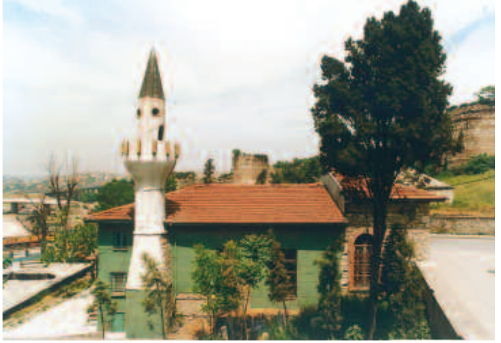
Resim3: Savaklar Mescidi, Eyüp Beld. Arşivinden, 1996, Kazım Zaim

miştir. Eski Blakhernai sonra Türk döneminde Ayvansaray adı verilen mahalle işte bu yeni tahkimatin arka tarafında kalmıştır. Eyüp'ten bakıldığında bugün görülen Haliç'e yakın kısımdaki kule ve duvarlar işte bu sonradan yapılan ekleme kısımlardır. Yaklaşık 415 tarihlerine doğru yapılan Theodosius duvarları Tekfur Sarayı'nın az ötesinde kesilmekte ve bir çıkıntı teşkil eden yeni tahkimat aşağıya doğru uzanmaktadır. Bu bölgede Bizans döneminde 11. yüzyıldan itibaren imparatorluk sarayı kurulmaya başlanmıştır. İmparatorların yüzyıllar boyunca devamlı büyüterek çeşitli binalarla zenginleştirdikleri ve hipodromdan Marmara'ya kadar uzanan sahada adeta şehir içinde bir şehir teşkil eden Büyük Saray denilen kompleks terkedilmiş ve imparatorlar bu şehrin kuzeybatı köşesindeki Blakhernai Sarayı'nı tercih eder olmuşlardır. Terkedilen eski Büyük Saray yıkılmaya başlamış ve hatta birçok mimari parçaları yapılmakta olan veyahut ihya edilmesi gereken çeşitli binalar da tekrar