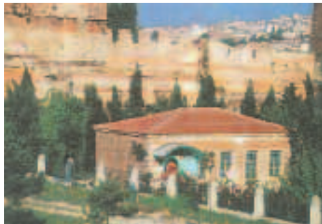
Resim13: Sahabe Türbelerinden Hz. Kaab Türbesi

Bu bölgenin Türk devrinde en hakim anıtı hiç şüphe yokki Edirnekapısı'nın iç tarafında ve İstanbul'un en yüksek noktasında yükselen Mihrimah Sultan Camii'dir. Mimar Sinan tarafından Kanuni Sultan Süleyman'ın kızı ve sadrazam Rüstem Paşa'nın eşi Mihrimah Sultan adına inşa edilen bu heybetli görünümlü mimari eser İstanbul'un tepelerini süsleyen büyük selatin camileri silsilesinin son halkasıdır. Kesin yapım tarihi hakkında bir bilgi yoksa da beraberinde inşa edilen hamamın inşa tarihi bilindiğine göre cami de 1555-1560 tarihleri arasında inşa edilmiş olmalıdır. Edir-