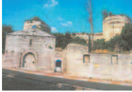
Resim15: Ayvansaray'da Surlar