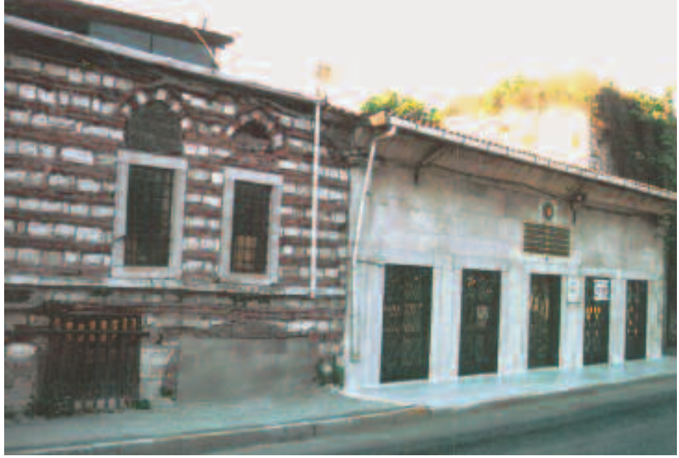
Resim20: Hatice Sultan mektebi

hoş görülemeyeceğinden başlarına sadece böyle kaba bir taş dikildiği ileri sürülür. Ancak şehir içindeki bazı hazirelerde de böyle taşlar vardır. Fatih Çarşamba'sında yahut Nişancı veya Tacizade Cafer Çelebi haziresinde bu tip taşlar olduğu gibi Üsküdar'da Duvardibi'nde Bağlarbaşı'na giden caddenin ucundaki su terazisinin az ilerisinde yine böyle kaba taştan birkaç mezar hala görülebilmektedir. Daha aşağıda Haliç'e yakın düzlükte yine sahabeden Ka'b Hazretlerinin türbesi bulunmaktadır. Bu türbe İstanbul'daki benzeri mezar binalarının hemen hemen hepsi gibi Sultan II. Mahmut döneminde inşa edilmiştir. Bu bakımdan 19. yüzyıl mimarisinin bir eseridir. Daha önceki yapısı hakkında bir fikrimiz bulunmuyor. Aynı bölgede Haliç kıyısında ise muazam bir sahil sarayı vardı. Bütünüyle ahşaptan inşa edilmiş bu sahil sarayı Sultan IV. Mehmed'in kızlarından, 1743'te vefat eden Hatice Sultan'a aitti. Eyüp kıyılarında hayli çok sayıda olan sahil sarayların en büyüklerinden biri olan bu Hatice Sultan Sarayı'nın hiç de-