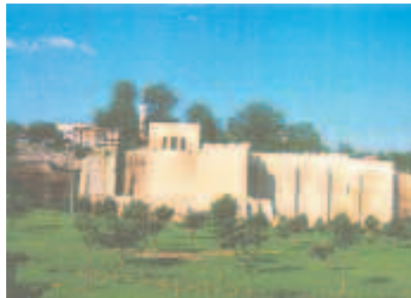
Resim1: Hüsrevpaşa Mescidi ve su terazisi Eyüp Beld. Arşivinden, 1996, Kazım Zaim

Bizans döneminin İstanbul'u güçlü bir sur tahkimatıyla batı topraklarından ayrılmıştı. İmparator II. Theodosius döneminde İstanbul'u Trakya'dan ayıran üç kademeli bir sura sahip olmuştu. Ancak şehrin kuzey batısında Blakhernai (Vlaherne) Mahallesi sur dışında kalmıştı. Ortaçağ tarihi boyunca şehri kuşatmaya gelen çeşitli kavimler ki bunlara barbar kavimler deniliyordu. Hiçbir vakit sur duvarlarını aşamamışlar. Fakat Blakhernai Mahallesi'ni kolayca tahrip ve yağmalamışlardı. Bu durum karşısında Bizans bu mahalleyi de surların içine almayı uygun görmüş ve üç kademeli tahkimattan daha değişik bir sisteme göre çok yüksek burçların koruduğu tek kat halindeki bir duvar ile bu bölge Haliç'e kadar çevril-