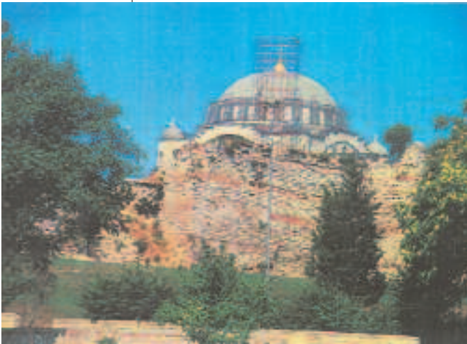
Resim9: İvaz Efendi Camii

nunda bütün suikastçılarla birlikte yakalanmıştır. İmparator Aleksios'un kızı Anna Komnena'nın yazdığına göre Anemas'ın gözlerine kızgın demirle mil çekilerek cezalandırılması kararlaştırıldığında herhalde genç prenses bu yakışıklı delikanlıya hissi bir takım düşüncelerle acımış ve annesine koşarak babası imparatoru bu karardan geri çevirmesi için ricacı yapmıştır. Bunun neticesinde gözleri kurtulan Anemas bir zindana kapatılmış ve bir süre burada kalmıştır. Dolayısıyla da bu mahsenler onun adını almıştır. Bu kalıntı sur duvarı ile içerdeki ikinci bir duvar arasında uzanan taş kemerli tonozlu bölümlerden oluşan ve arazi burada meyilli olduğundan hayli yükseğe kadar çıkan bir mahsendir. Anlaşıldığına göre Blakhernai saraylarının bir kısmının alt yapısıdır. Bu ve son Bizans döneminde zindan olarak kullanılmış olması da kuvvetle muhtemeldir. 14. yüzyılın ilk yarısı içlerinde iktidar kavgası içinde çalkalanan bizans imparatorluğunda entirikalarıyla büyük bir servet sahibi