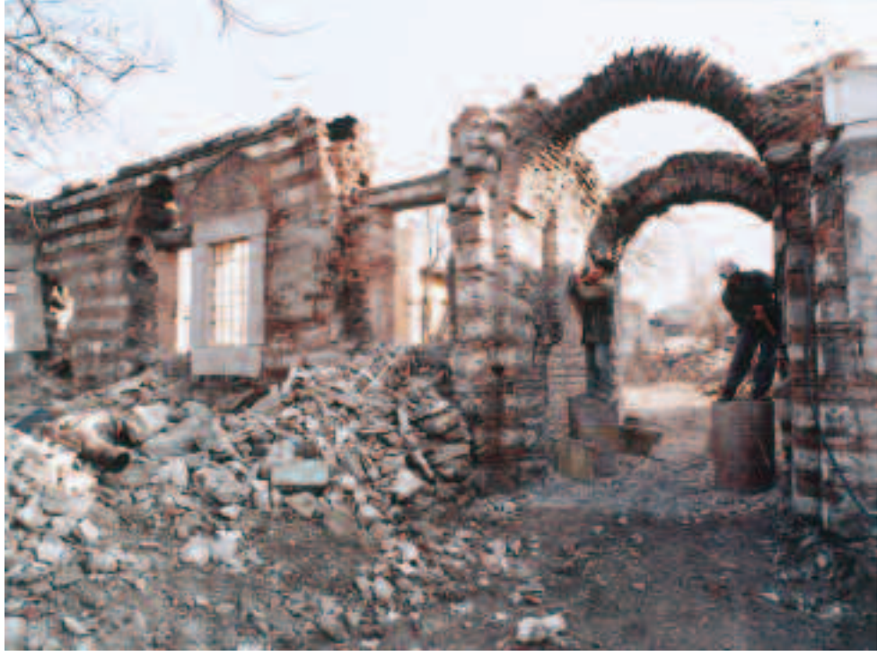
Resim12: Maktul Mustafa Paşa Mescidi (Restorasyon önce- si), Eyüp Beld. Arşivinden, 1996, Kazım Zaim

basit planlı bir Bizans şapeli bulunuyordu. Sağlam bir dayanak olmaksızın Aya Thekla kilisesi olarak adlandırılan bu yapı fetihten sonra Toklu İbrahim Dede adıyla mescide çevrilmiş ve 1920'li yıllara kadar kullanılmıştır. Bu tarihten az sonra yanında dar bir aralık halinde olan geçit yolu genişletmek bahanesiyle 1928'de yarısı yıktırılmıştır. Mihrap duvarının bir parçası ile güney duvarı duran yüzeyleri Bizans freskolarıyla süslü olan bu tarihi duvar maalesef 1970'e doğru yerlerine evler yapılmak üzere yok edilmiştir. Az ötesinde ise gerçek Aya Thekla Kilisesi olması muhtemel ikinci bir Bizans dini yapısı daha bulunmaktadır. Fetihden sonra