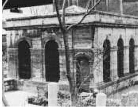
Resim6: Yavedud Türbesi

yapıyı tarihleme hususunda çeşitli görüşler ileri sürülür. Değişik hipotezler yaratılır. Bizim düşüncemize göre bu bina Komnenos sülalesinin önemli hükümdarlarından biri olan I. Manuel Komnenos (1143-1180) tarafından yaptırılmıştır. Bir Bizans kaynağı onun burada "şehre, denize ve arkadaki araziye hakim bir yerde" bir saray binası inşa ettirdiğini bildirir. Tarihi İstanbul'un en yüksek rakımlı bölgesinde bulunan Tekfur Sarayı'nın bu tarife çok uygun bir bina olduğu açıkça belirlidir. Buradan bütün şehre deniz denilen Haliç'i ve arkadan ufka kadar uzanan Trakya arazisini görmek mümkündür. Dikdörtgen biçiminde bir planı olan, en altta kagir kubbeli tonozlarla örtülü ve önünde bir açık avlu uzanan bir zemin katının üstünde ahşap döşemeli iki kat bulunuyordu. Bol pencereleri ile aydınlanan bu katların en üsttekinin Haliç'e bakan tarafında bir balkonun bulunduğu da izlerden anlaşılır. Ayrıca bu katın şehre bakan cephesinde içine ancak bir kişinin girebileceği cumba şeklinde küçük bir ibadet yerinin kalıntısı da dikkati çeker. Üstü aslında ahşap bir çatıyla örtülü olan binanın dış cepheleri çok zengin bir taş ve tuğlalardan yapılan bezeme ile kaplanmıştır. Bunların arasında süs çömlüklerinin de varlığı dikkati çeker. Bu pavilyonun tek başına ol-