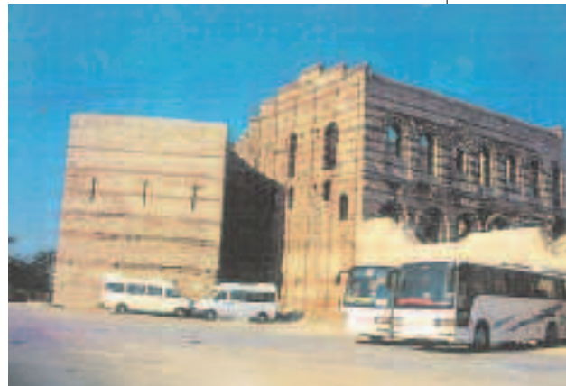
Resim7: Tekfur sarayı

madığı da anlaşılmaktadır. Nitekim önündeki avlunun kuzeybatı köşesinde sur duvarı üzerinde sıralanan bir sıra pencere bunların arkasında da bir pavilyonun bulunduğunu açıkça belli eder. Ancak bu ikinci yapı Tekfur Sarayı adı verilen kadar yüksek değildir. Bir vakitler bu duvar parçasındaki pencerelerden birinin alınlığında son dönem Bizans imparatorlarının alameti olan bir haçin dört kolu arasında dört B harfinden oluşan bir arma bulunuyordu. 19. yüzyılda çevredeki rumlar tarafından bu arma yerinden sökülerek surların iç tarafındaki Panaghia Kilisesi'ne götürülmüştür. Blakhernai saraylarının mahsen halindeki geniş ölçülere kadar yayılan kalıntıları bugün Eğrikapı semtinin binalarının altında uzanmaktadır. Fakat önemli bir parça sur duvarına komşu olarak hala durmaktadır. Bu da Anemas zindanı denilen kalıntıdır. Bu-