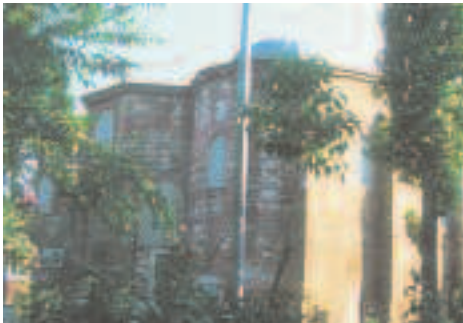
Resim16: Atik Mustafa Paşa (Cabir) Camii

Resim14: Mellin'in gravürlerinde Ayvansaray'da Hatice Sultan Sahil Sarayı nekapısı ile Eğrikapı arasındaki bölgede surların içinde kalan bölge türkler tarafından iskan edilmiş olmakla beraber Edirnekapısı'nda Kariye Camii'ne giden surlara paralel bir sokak yaklaşık 30-40 yıl öncesine gelinceye kadar rum evleriyle doluydu. Hatta bu rumların Edirnekapısı'nın iç tarafında Ayos Konstantinos adında mütevazi bir kiliseleri hala durmaktadır. Bu rumların mezarlıkları da sur dışında müslüman mezarlıklarına komşu olarak 1955'lere kadar duran hendeğin hemen kenarında idi. Bunlar basit birer haçtan ibaret ve sadece ölünün adı yazılı olan mezar işaretleri idi. Bu kesimdeki hendek Menderes istimlaklerinde çıkan molozlarla doldurulduğundan arazi tamamen düz bir hale geldi ve az sonra da bu mezarlık ortadan kaldırıldı. Şimdi yeri futbol oyunları sahası halindedir. Bu bölgede yahudilerin de yaşadıkları anlaşılıyor. Hatta 19. yüzyıl içlerinde Tekfur Sarayı binası bir "Yahudihane" yani yahudi ailelerin toplu olarak yaşadıkları