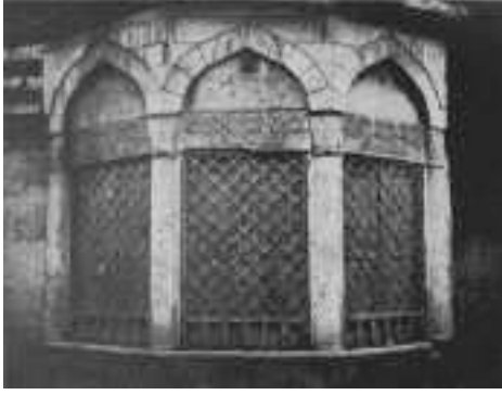
Resim5: Hatice Sultan sebili

yapıyı tarihleme hususunda çeşitli görüşler ileri sürülür. Değişik hipotezler yaratılır. Bizim düşüncemize göre bu bina Komnenos sülalesinin önemli hükümdarlarından biri olan I. Manuel Komnenos (1143-1180) tarafından yaptırılmıştır. Bir Bizans kaynağı onun burada "şehre, denize ve arkadaki araziye hakim bir yerde" bir saray binası inşa ettirdiğini bildirir. Tarihi İstanbul'un en yüksek rakımlı bölgesinde bulunan Tekfur Sarayı'nın bu tarife çok uygun bir bina olduğu açıkça belirlidir. Buradan bütün şehre deniz denilen Haliç'i ve arkadan ufka kadar uzanan Trakya arazisini görmek mümkündür. Dikdörtgen biçiminde bir planı olan, en altta kagir kubbeli tonozlarla örtülü ve önünde bir açık avlu uzanan bir zemin katının üstünde ahşap döşemeli iki kat bulunuyordu. Bol pencereleri ile aydınlanan bu katların en üsttekinin Haliç'e bakan tarafında bir balkonun bulunduğu da izlerden anlaşılır. Ayrıca bu katın şehre bakan cephesinde içine ancak bir kişinin girebileceği cumba şeklinde küçük bir ibadet yerinin kalıntısı da dikkati çeker. Üstü aslında ahşap bir çatıyla örtülü olan binanın dış cepheleri çok zengin bir taş ve tuğlalardan yapılan bezeme ile kaplanmıştır. Bunların arasında süs çömlüklerinin de varlığı dikkati çeker. Bu pavilyonun tek başına ol-