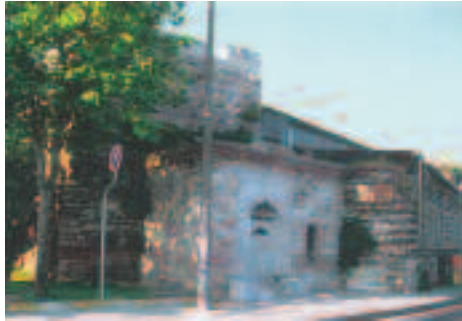
Resim18: Hatice Sultan mektebi ve çeşmesi

fettiği cami vardır. Buradan Haliç'e doğru inilen küçük bir mahallenin içinde iki cami daha vardı. Bunlardan biri Maktul Mustafa Paşa Camii ve tekyesi idi. 1765 yılında sürgün olarak yollandığı Midilli adasında idam edilerek oraya gömülen Maktul Mustafa Paşa, camii çok perişan ve harabe haline getirilmiş iken son yıllarda Eyüp belediyesinin de gayretleriyle Büyükşehir Belediyesince yeniden düzene sokulmuş ve restorasyon yapılarak tekrar ibadete açılmıştır. Yine Haliç'e uzanan aynı yamaçta bulunan Hacı Hüsrev veya Yeni Mahalle Mescidi'nin ise tarihi daha gariptir. Haliç üzerinde yeni yapılan Hasköy-Ayvansaray köprüsünün tam bitim noktalarına komşu olduğundan burada Yeni Mahalle denilen semt bütünüyle ortadan kaldırılmıştır. Ayrıca zaten dört duvar halinde yıkık minaresiyle duran cami, köprü'nün hemen başlangıcında bir yanar dağ krateri gibi çok büyük yuvarlak bir çukurun dibinde bırakılmış ve etrafındaki toprak kotu inanılmaz derecede yükseltildiğinden harap cami taştan bir duvarla sarılarak bu garip kuyu-