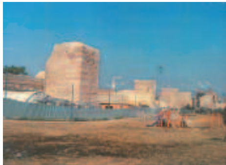
Resim11: Edirnekapısı'nda n Ayvansaray'a doğru surlar

Tek kat halindeki sur duvarı Anemas zindanlarından doğru aşağı inmekte ve burada küçük bir iç kale şeklinde oluşmuş olan bir düğüm noktasına ulaşmaktadır. Haliç kıyısına kadar inen bu küçük iç kalenin içinde bir sahabe türbesinden başka oldukça kalabalık bir hazire de vardır. Bu küçük iç kalenin hemen şehir tarafında evelce