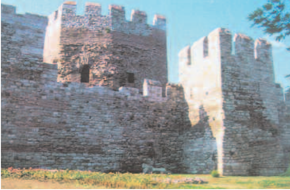
Resim19: Ayvansaray'daki burçlar

nun dibinde kalmıştır. Önceki gibi belediyelerin himmetiyle bu cami tamamen sökülerek kuyu dibinden çıkarılmış ve yukarda yeni bir yere yeni baştan inşa etmek suretiyle ihya edilmiştir. Oldukça garip bir tutum ile Kara Yolları İdaresi metrelerce derinlikteki bu dev ölçülü çukuru duvarla desteklemek uğruna büyük ödeme yapılmasını bahane ederek tenkitte bulunmuştur. Haliç'e inen yamaçta bundan sonra mezarlıklar bulunuyordu. Gerek surlara komşu gerek daha Eyüp'e doğru. Ve aradan da Edirnekapısı'ndan çıkıp Eyüp'e uzanan eski tarihi yol uzanıyordu. Her iki taraftaki mezarlıklar da köprünün yapımı ile birlikte bütünüyle ortadan kaldırılmıştır. Halbuki bunların İstanbul tarihinin birer parçası olan taşları uygun bir yerde yeniden düzenlenebilir ve ağaçlandırılarak yine bu mezarlıklar ki bunların bir tanesi Tokmak Tepe mezarlığıdır yaşatılabilirdi. Çok yakın tarihlerde cereyan eden bu olaylardan üzüntü duymamak imkansızdır. 1957-58 tarihlerinde Edirnekapısı'ndan Eyüb'e inen geniş yeni bir