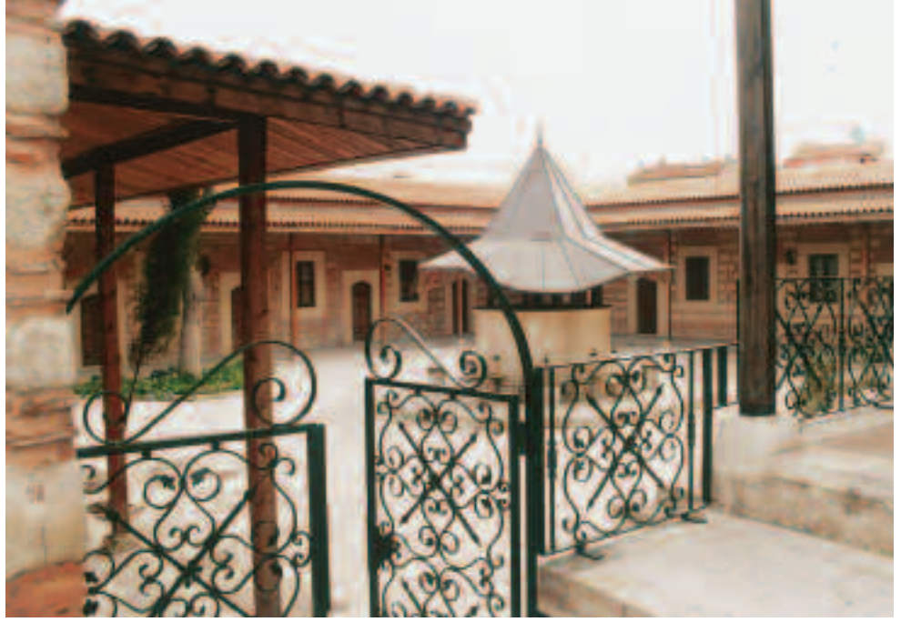
Resim8: Maktul Mustafa Paşa Külliyesi ve Medrese- Şardavandan bir kesit, Eyüp Beld. Arşivinden, 1996, Kazım Zaim

raya Anemas adı da 11. yüzyıl sonlarında cereyan etmiş olan bir olay ile ilgili bir kişiden dolayıdır. İslam ve Arap hakimiyetine girmiş olan Girit adası bizanslılar tarafından tekrar geri alındığında esir olan son muhafız hristiyanlığa geçerek Bizans hizmetine girmiştir. İşte bunun soyundan gelen arap asıllı bizanslı bir genç olan Anemas imparator I. Aleksios Komnenos (1081-1118) döneminde imparatora karşı bir ayaklanmaya katılmış fakat hiçbir girişimde daha bulunamadan bir ihbar so-