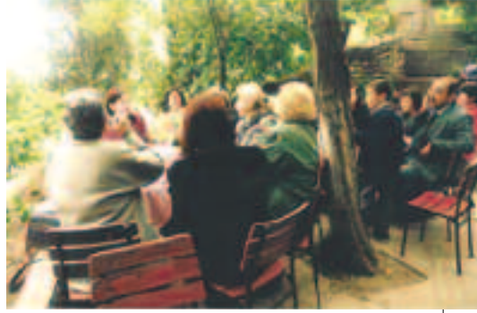
Pierre Loti kahvesinde sempozyum sonrası çay keyfi 1997

açılmış olan, seramik, fotoğraf, hat, resim, Türk el sanatları, çini, cam altı re-