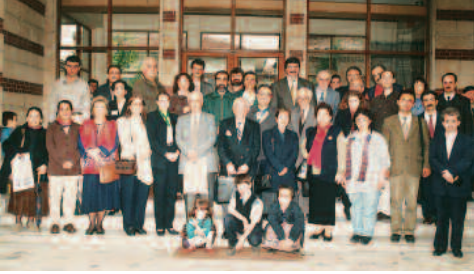
Fotoğrafa bir bakar mısınız? Kimler yokki. Akademisyenler, sanatçılar, yazarlar. Yani bütün ülke. Hepsine teşekkürler. 1998