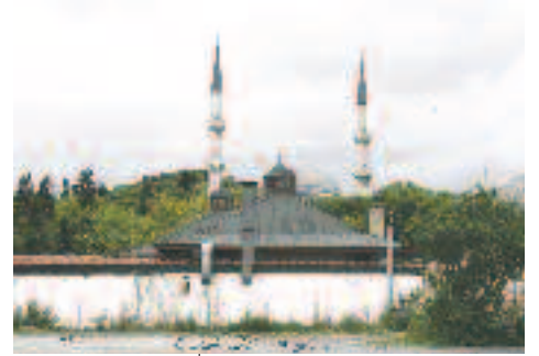
Resim 3: Geçmişini Temsil Eden Olumlu Yeni Bir Yapı Örneği (Eklenmiş Bacalar Hariç)

c) Tüm yapı elemanları ritmik bir kümelene özelliği gösterir. Sadece yapı kendi bütününde değil, doğal ortamla da bir çeşit karşıtlık armonisi kurar. Minareler servilerle rekabet eder ve biçimsel olarak tekrar eden bir görsel müzikalite doğar. (Resim:3)