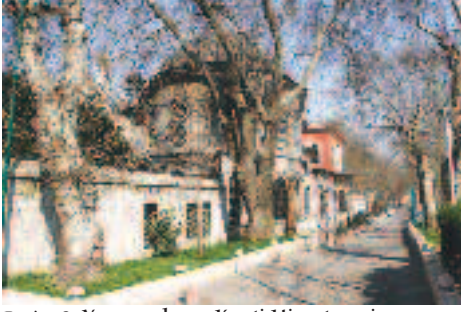
Resim 9: Yaşayanların Kenti Hissetmesine Olanak Sağlayan, Dokunma Duyusunu Uyarıcı Taş Dokulu Yollar

unutkanlık veya yanlışlık eseri olmadığını söyleyebiliriz. Zira Zal Mahmut Paşa, Rüstem Paşa vb birçok külliyelerde de aynı uygulamaya tanık olmaktadır. (Resim:6)