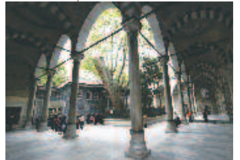
Resim 4: Mimari Yapının Doğal Ortamla İlginç Uyuşumu