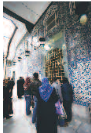
Resim 7: Eyüp Türbesinin Gizini ve Mistikliğini Bozan Hacet Penceresi Yeni Şebeke Demiri

d) Daire ile üçgen karşıtlığı minare ve kubbe formlarında temel kurgudur. Bu zıtlık Eyüp mimari yapılarını diri, canlı ve dinamik bir kimliğe kavuşturur. Minarelerin sivri külahları, kubbe çıkıntıları ve bacalar daireliliğin dinginliğini göğe taşımaya çalışırken, kubbenin daireliliği de göğü yere indirme çabası içindedir. Bu karşıtlıktan etkili ve gerilimli bir kent atmosferi oluşmaktadır. Belki şunu söylemek daha doğru olacaktır: gökten yağın rahmeti simgeler kubbelerle, yerden fıskıran bereketin imgesi minarelerin oluşturdukları karşıtlık armonisi Eyüp kent estetiğinin de ana belirleyicisidir.