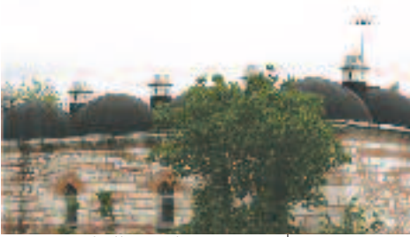
Resim 6: Sokullu Medresesi'nin Plastik Etkisini Olumsuz Etkilemiş Kesik Baca Örnekleri