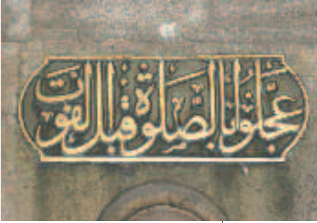
Resim 5: Eyüp'teki Mimari Yapıları Süsleyen Türk Hat Sanatı Örneklerinden (Eyüp Camii İç Avlu)