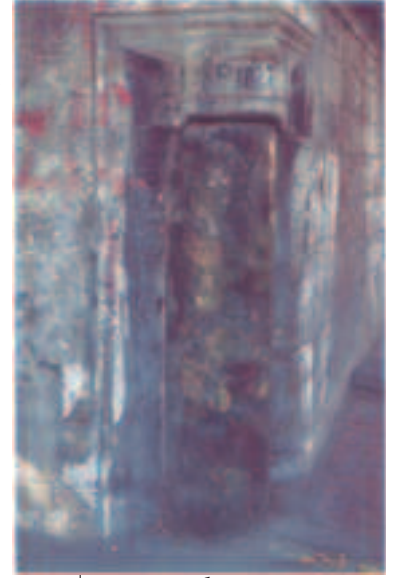
Resim 10: Dokunma Duyusunu Uyarıcı Şehzadebaşı Camii Duvarındaki Dönel Silindir