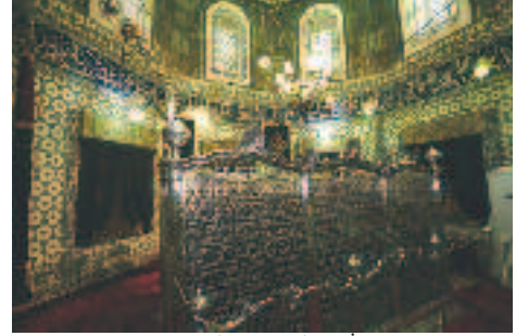
Resim 8: Eyüp Sultan Türbesi İç Görünüşü

a) Eyüp sadece plastik değerler açısından bir bütün değil; tarihi, dini ve sosyal uyarınlarıyla da önemli ve özellikli bir yerleşim birimidir. Bu uyarınlar ilgi ve algılarımızı devamlı diri tutarlar.