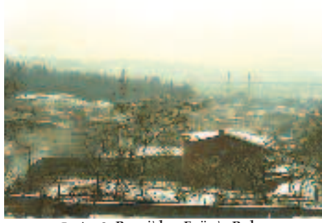
Resim 2: Rami'den Eyüp'e Bakış

A) Plastik Öğeler Yönünden: İstanbul’un fethinden sonra Türk -İslam