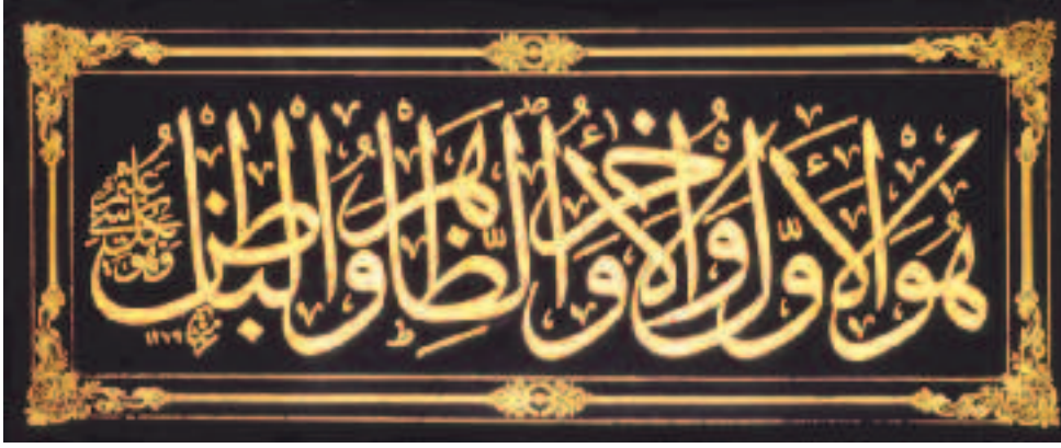
Resim 5: Kadıasker Mustafa İzzet Efendi'nin 1279/1862 tarihli celî sülüs zer-endûd (Kur'ân-ı Kerîm, LVII,3) levhası, (SSM Hat Koleksiyonu,106)

mişdir. Arasına kullandığı "Hâk-pây-i evliyâ, Seyyid İzzet Mustafâ" manzum imzâsını, ömrünün sonlarında "Bende-î Âl-i Abâ, Seyyid İzzet Mustafâ" ya çevirmişdir. Celî sülüslerinde ise Râkım tarzında Ketebehû Mustafa İzzet istifini benimsemekle beraber, celî tevkî' hatıyla sâdece İzzet (Resim:5) yazdıkları da az değildir.