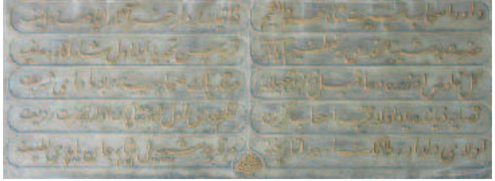
Resim 8: Ayvansaray'daki Ebû Şeybetî'l-Hudrî türbesi kitâbesi

Gel, hulûs üzre duâ kıl, zâirâ, tebcîlle, Merkad-i pâk-i sahâbîdir bu me'vâ-yı şerîf.