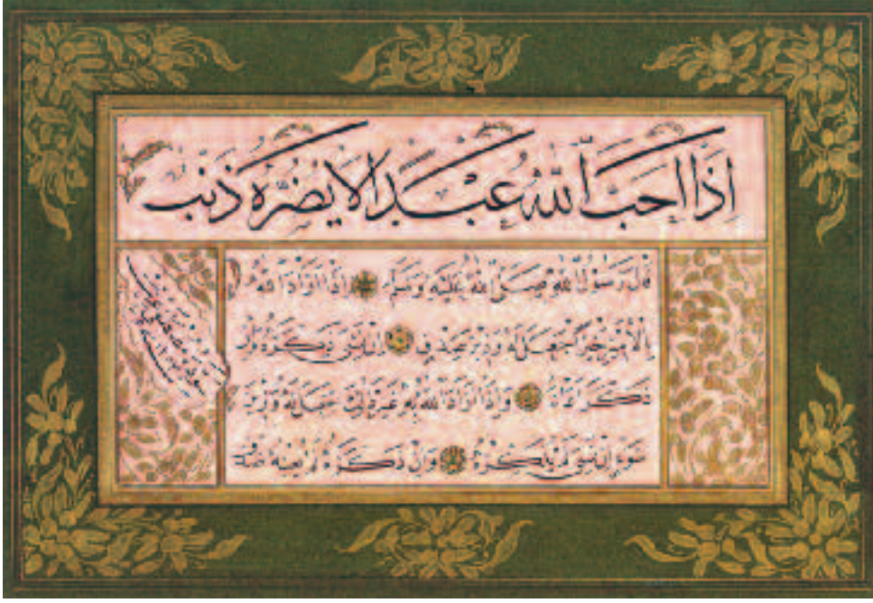
Resim 4: Mustafa İzzet Efendi'nin 1254/1839 tarihli sülüs-nesih kit'ası (Topkapı Sarayı Müzesi, G.Y.324'den)

dişâhın birinci imamlığına getirildiğinde de Rumeli kadiaskerliği pâyeleri verildi. Ertesi yıl şehzâdelerin yazı muallimliğine ve veliahd Abdülazîz Efendi'nin (saltanatı:1861-1876) müzâkerciliğine tâyin olundu. 1265/1849'da hocası Yesârîzâde'nin vefâtı üzerine, onun Bebek'deki yalısını vereseden satın alarak, daha sonraki hayâtını burada geçirdi.