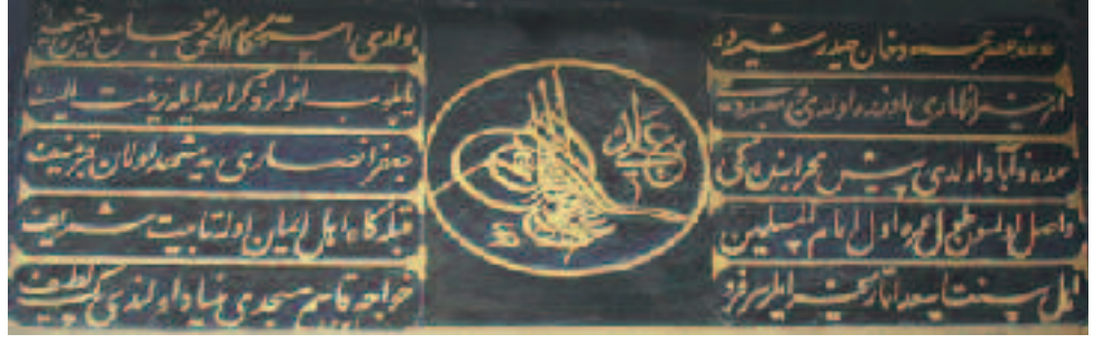
Resim 11: Balat'da Hâce Kasım mescidi ile Câfer-i Ensârî kabrinin müşterek kitâbesi

Oldu bu merkadin ihyâsına, Es'ad, târîh, Hâfir'in rûhunu Sultân-ı cihân kıldı şâd.