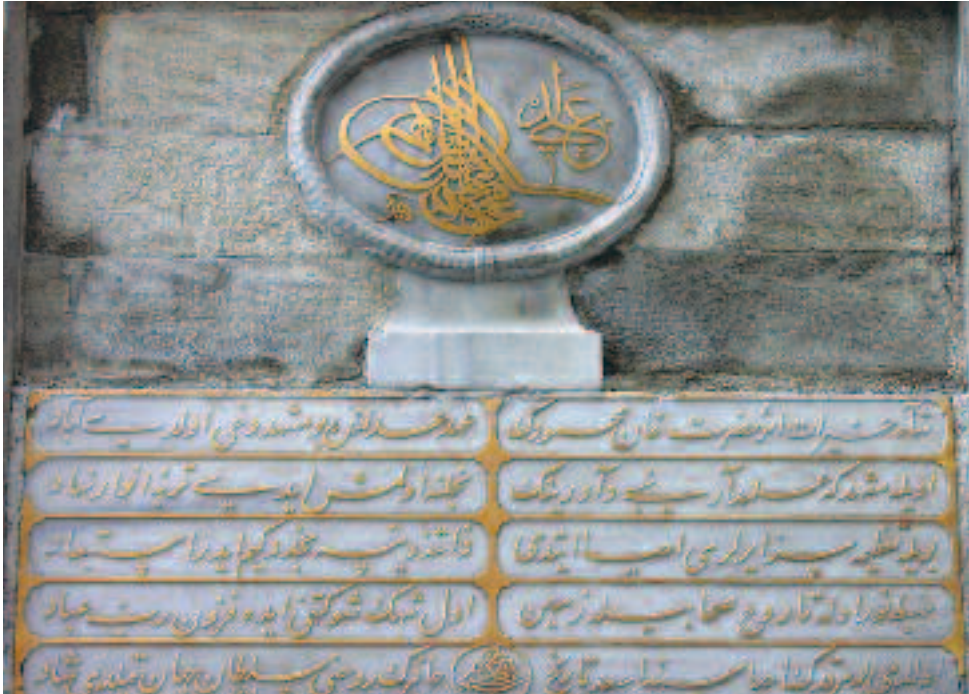
Resim 10: Eğrikapı'daki Hâfir kabrinin kitâbesi

Mehbit-ı nûr ola tâ rûh-ı sahâbîle zemîn Ol Şeh'in şevketini îde füzun Rabb-i ibâd.