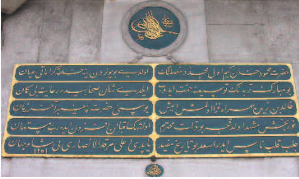
Resim 7: Ayvansaray'daki Muhammedü'l-Ensârî türbesi kitâbesi