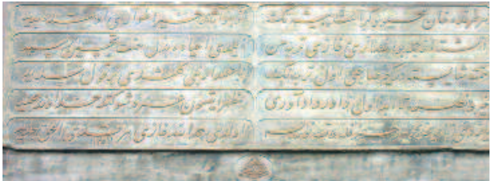
Resim 9: Ayvansaray'daki Hamdullah-ı Ensârî türbesi kitâbesi

Eyledi ihyâda bezl-i himmet-i tahsîn resîd.