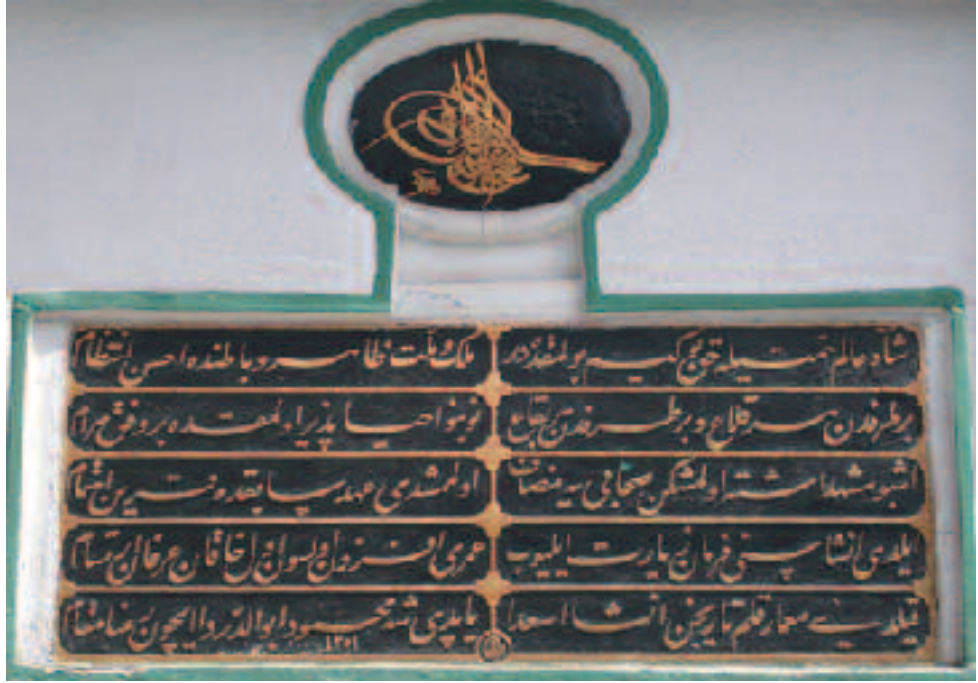
Resim 6: Eyübsultan'daki Ebu'd-Derdâ türbesi kitâbesi

kanuna göre- kazaya kurban gitdikleri anlaşılmaktadır 10 .