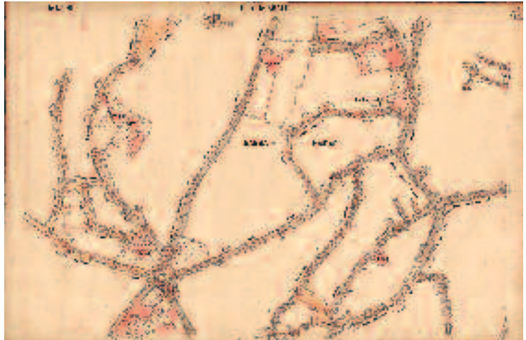
Harita-7 Eyüp Baba Haydar ve civarı yerleşimi (Eyüp Bld. planlama arşivi)

araştırmacıların malzemesi olan eser, her bir sayfasında ve bu arada İstanbul bakımından çok kıymetli bir klavuzdur. İstanbul ve çevresi için hazırladığı minyatür bir tek yazma nüshada mevcut değil fakat müstensihler tarafından yeniden yaratıldığı sırada, sanatkârlar da faaliyet geçirilerek bu mekânın zenginliğine değinilir. Gene aynı asır içinde yetişen Matrakçı Nasuh tarafından yaratılan devasa minyatürlü eserde bile İstanbul için hususi bir yer ayrılmış ve büyük bir dikkat ile burasının tasviri ya-