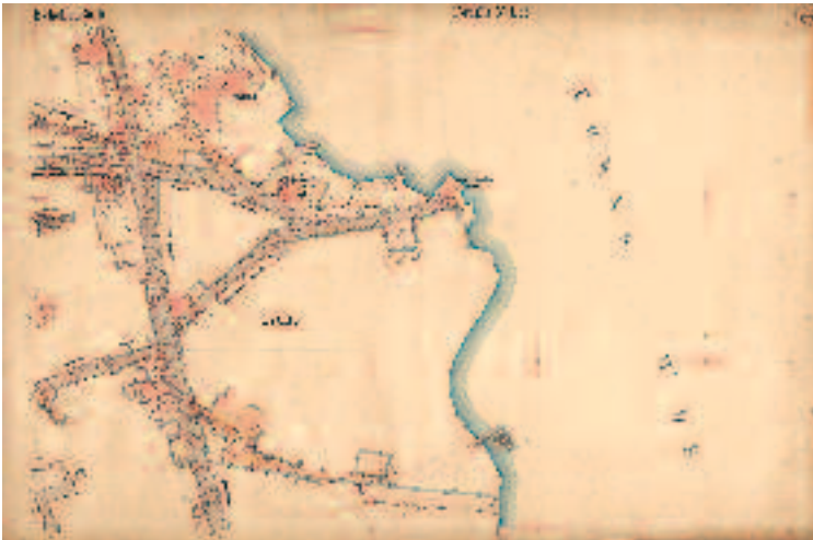
Harita-5 Haliç kıyısı Eyüp yerleşimini gösteren harita civarı (Eyüp Bld. planlama arşivi)

mûhtelif hedeflerini dile getirirken İstanbul'un zenginliğini tekrarlamakdan usanmamışlardır. Bu arada maiyetlerinde bulunan sanatkârlar da, eser sahibi ile b e r a b e r