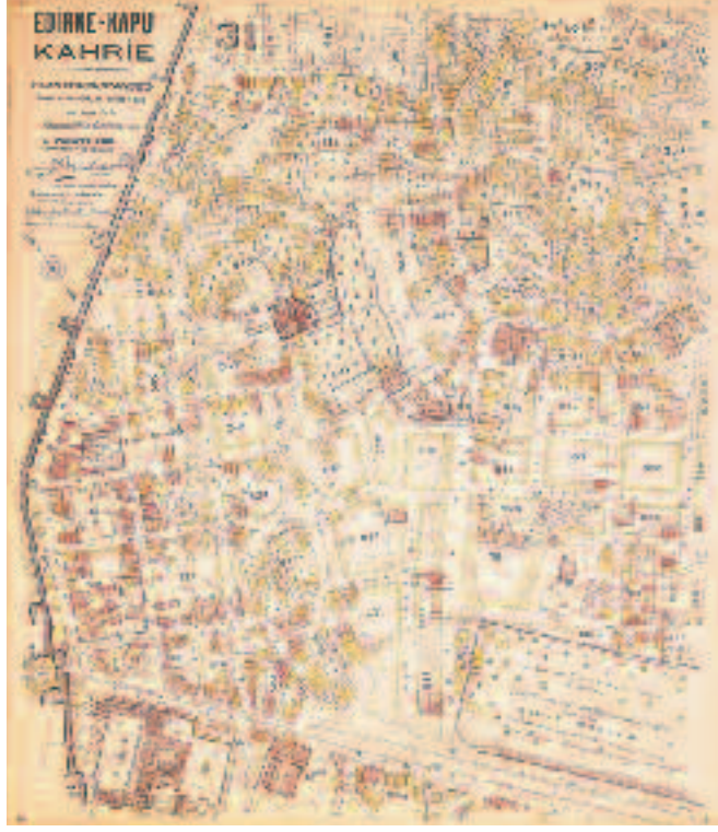
Harita-4 Haritalarında İstanbul Axa Oyak Sigorta sf.175

Harita mevzuu, Bizans İmparatorluğu devrinden başlayıp, günümüze kadar devam eder. Bu şehrin tesisinde dikkat edilen coğrafya şartları, sonraki asırlarda ve hatta günümüzde bile ağırlığını hissettirir. Bu şehrin methiyesini kaleme alanlar, tavsirlerinde bu meziyete temas ederler. Harita ile uğraşanlar da, bu müstesna şehrin tarihi