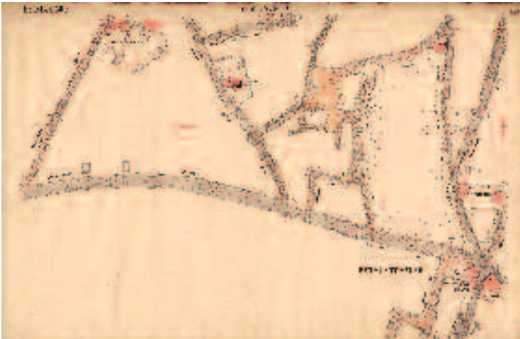
Harita-8 Fethi Çelebi, Otağcılar, Tokmatepe civarını gösteren harita

alır. Muhtelif araştırmalar mevzu olan Eyüb ve çevresi, İstanbul'un fethinin yakınlaştığı bir sırada, bir rüya neticesinde bulunduğu ve sonradan da tasavvufî bir havaya büründürülmesi, yeni bir iskân sahasının yaratılmasına yol açmış, fakat ananevi miras da hiç bir zaman ihmâl edilmemiştir. Başda türbesi ve câmii ile büyük bir tesir yaratan bu teşekkül, bir rastlantı neticesinde ulaşılmadı. Tarihin eski devirlerinden başlayıp Bizans İmparatorluğu devrinde de bir mukaddes havasının yaratılmasına yol açması uzantısında Türk İskânı