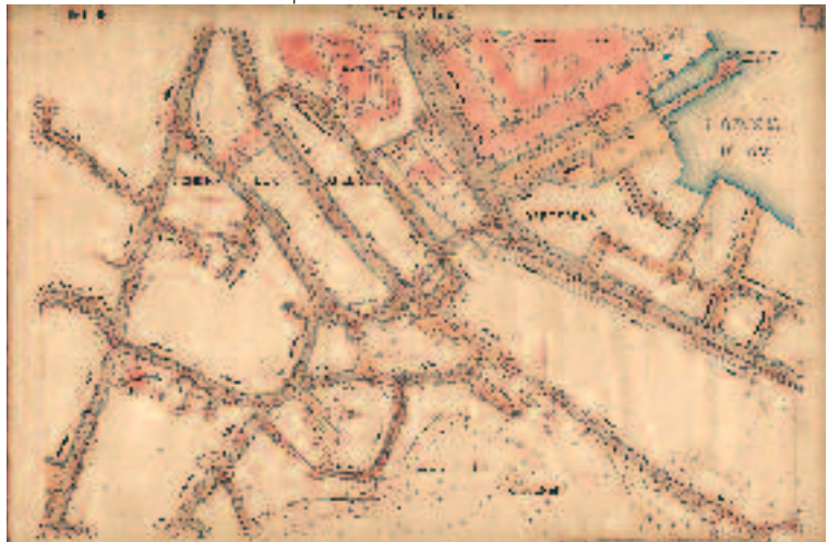
Harita-3 Eyüp Defterdar civarı (Eyüp Bld. planlama arşivi)

İstanbul'un tesis edilışinden sonra geçirdiği safhalar ve eşsiz kalıntının tarihte oynadığı etki, Bizans İmparatorluğu zamanında hızlı gelişir ve ortaya bol sayıda malzeme arz edilmesi sonrasında 29.5.1453 günü bir Türk şehri hüviyetine bürünüp de, kısa bir zaman sonra başşehir yapılması yeni bir Türk şehri karakterini de berâberinde getirdi. İlk Osmanlı kroniklerinden başlayıp ve hatta devrin yabancı kaynaklarına da geçen malûmâta göre, Osmanlılar yaptıkları yatırımlar, gerçekleştirdikleri sürgünler, yarattıkları kalıcı eserler sâyesinde epey malzemenin ortaya çıkmasına, devrin tariçi-