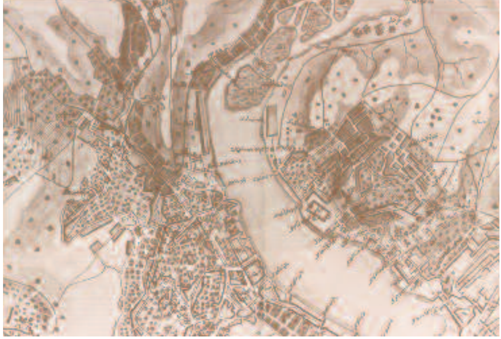
Harita-6 Sedad Hakkı Eldem İstanbul Anıları. Resim.134 Haliç içinin 1845 tarihli haritası. sf. 214,215

yarattıkları görüntüleri, minyatürlerde ve muhtelif baskı eserlerinde hayata geçirmişlerdir, bu malzeme de bugün çok istifâde ettiğimiz kaynaklar arasındadır.