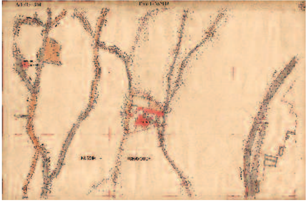
Harita-9 Kasım Çavuş, Bülbül Deresi, Kırk Merdiven civarını gösteren harita (Eyüp Bld. planlama arşivi)

Burayı meskûn bir seviyeye getiren kişileride takdir etmemiz kaçınılmazdır. Bu mantıkların muhâfazası ile beraber, Türk mimâri zevkini ve günlük hayatın devamındaki tesir, mistik bir ananenin, yeni boyutlar kazanması sayesinde çağdaş bir görünüm kazandırmıştır.