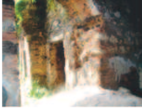
Dershane ve Mescid Olarak Kullanılan Kısım