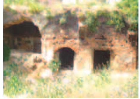
Medrese Hücrelerin Halihazırdaki Görünümü