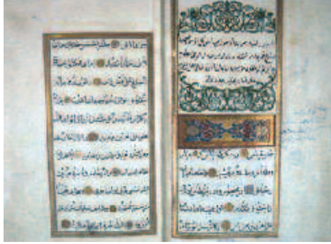
Orijinal Vakfiyenin ilk Sahifesi Hacı Beşir Ağa, 682

Beşir Ağa, külliye inşa ettirdiği müesseselerin işletilmesi, ihtiyaçlarının karşılanması, eğitim veren ve alanların rahat ve huzurlu bir faaliyet yapabilmeleri amacıyla 1 Rebiulahir 1148/21 Ağustos 1735 tarihinde bir vakfiye tanzim etmiştir. 3 Akabinde, Gurre-i Şa-