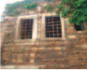
Muallimhane ve Sibyan Mektebi