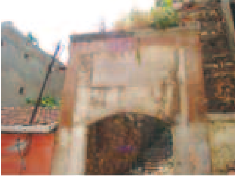
Darulhadis'in Giriş Kapısı ve Kitabesi

medresesinde vakıf şartlarından farklı olarak bir müderris ve sekiz talebe kalmakta olup, bunların isimleri şöyledir: