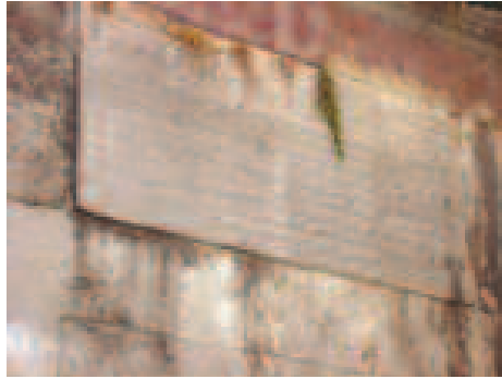
Kitabenin Yakından Görünüşü

1914'te medrese tamamen harap hale gelmiş, teftişe gelen heyet tarafından kapsamlı bir rapor hazırlanarak külliyenin yeniden inşa edilmesi planlanmıştır. Ancak I.Dünya savaşının başlaması ile tamirat gerçekleşmemiş ve bu tarihten sonra âtil kalmıştır. Sa-