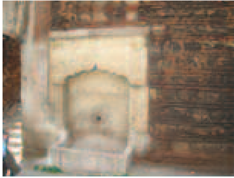
Daha Sonraları Tamir Edilerek Günümüze Ulaşan Çeşme

Lane-i tek hüma mehdine her ma'nâ 5-Yane lâzım kalem-i âcize vasfın tahrir Hasb-i hâlin eser-i hayri kılar rükn-i ima Ders-i medhin mekârim-i şimin ey hâce Sebk-i amnur nazm kılmağa hacetine ru 6-Edelim hayır duayı bize vâcib oldur Kılalım dırki mevlâya senayesin inhâ Izzu rif'at ile zîşan-ola rabb-i hemin Tusen-i barh muradınca ola pa-bercâ 7-Oldu bu mısra-i pakize Münibâ târih Camii- ilm ve amel Daru hadis-i zibâ 1147 23