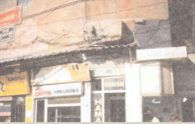
■ Eyüp Türbe Hamamı'nın kapısı ve çevresi. 1995 Eylülünde hamamı kuşatan dükkanlar yıkıldı.

İlklık üzerinde büyücek bir kubbe bulunmaktadır. Kapının sağ tarafında, duvar boyunca uzanan, L şeklinde mermer bir peyke, sol tarafında kapıları ayrı iki göz tuvalet ve iki göz traşlık hücreleri vardır. Tuvaletler beşik tonoz, traşlık ise biri kubbeli diğeri tonos çatılıdır. Harare kapısının solunda da bir çeşmecik bulunmaktadır.