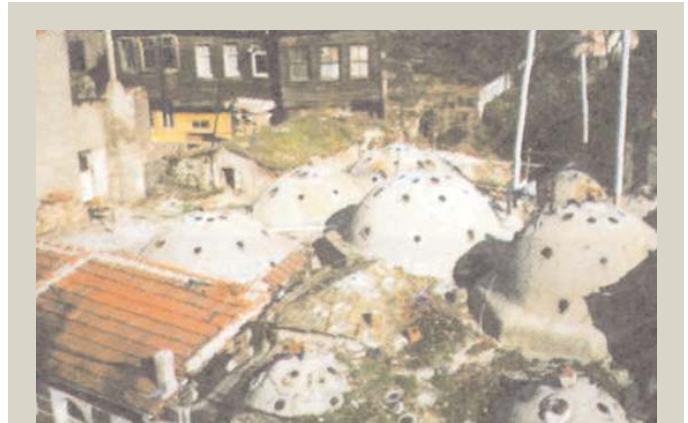
■ Eyüp Türbe Hamamı'nın üstten görünüşü.

Hamam, "Eyüp Sultan Camii Kebir Hamamı" ve "Fatih Sultan Mehmed Hamamı" isimleri ile de anılır. Kendine mahsus bir planı olan hamama dar bir kapıdan girilir. Geniş olan cemaat kısmının sağ ve solundaki dükkanlar yakılarak küçültülmüştür. Üst kat soyunma odaları bu dükkanların üzerine yerleştirilmiştir. Dışarıdan bakıldığında, diğer hamamlarda olduğu gibi, bir evi andırır.