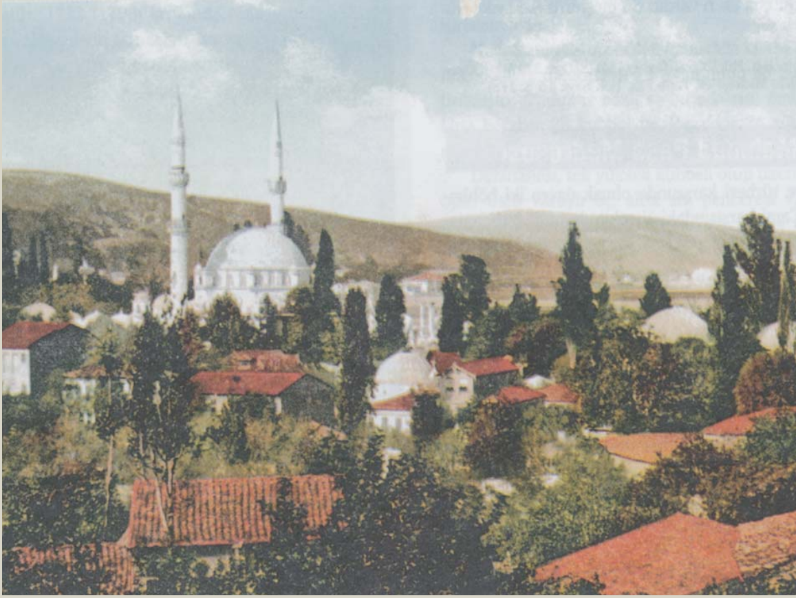
■ Cumhuriyet öncesi yıllarda Eyüpsultan