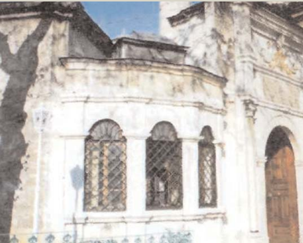
■ Eyüp Sultan Camii Sebili

Kesserah İllahu hayrehu ve sekâhu Bî-miyâh 'ün-na'im fîukbâhü İtdi bu câmi'inde bi'r-i cemil Teşnegân-ı tarike yapıdı sebil