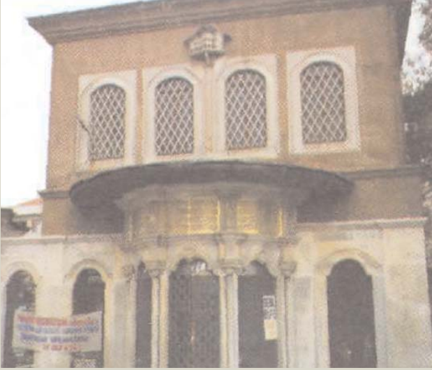
■ Şah Sultan Sebili ve Mektebi

Şah Sultan ve kitabe yazarı İhya Efendi için Şah Sultan Türbesi bahsine bakınız.