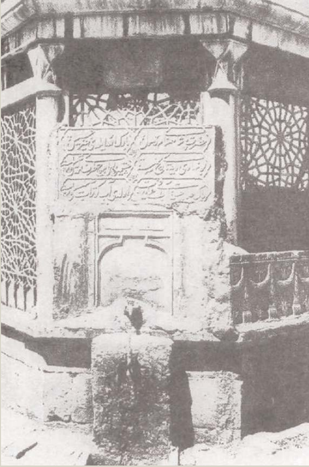
■ Kaptan-ı Derya, Sadrazam, Sokullu Mehmet Paşa Sebili-Çeşmesi'nin eski durumu.

Bahş itdi mâl muhibb-yâb dünyâyı itdi fezyâb Kurb-i Ebf Eyyüb'e âb icrasına kıldı nigâh Bir nev sebil itdi bina hem boş edâ hem canfeza Nezdik eshâb-ı safâ Rıdvân-ı Halide şâhrâh