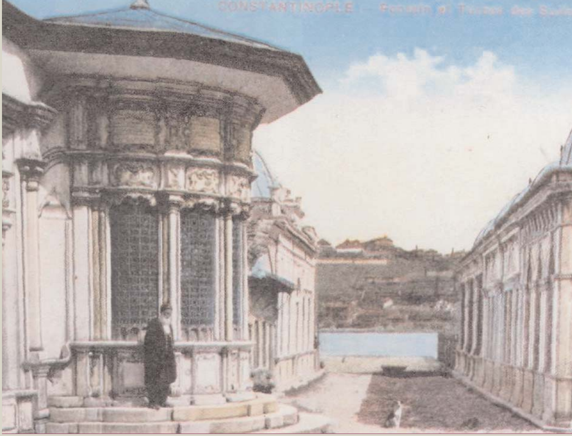
■ Mihrişah Valide Sultan Sebili