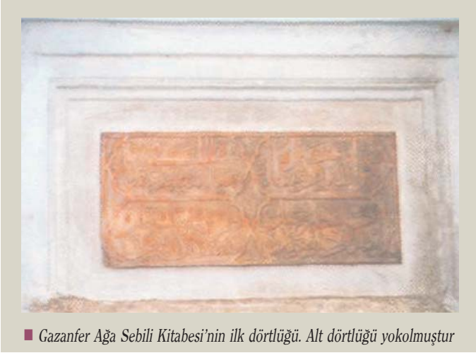
■ Gazanfer Ağa Sebili Kitabesi'nin ilk dörtlüğü. Alt dörtlüğü yokolmuştur

Suyun içüb cemi bâý ü gedâ Eylüsen sahibine hayr-t du'â Görüb ânı didi bu abd-i za'if Târih olsun sebil-i hüd ü latif 1008 (1599)