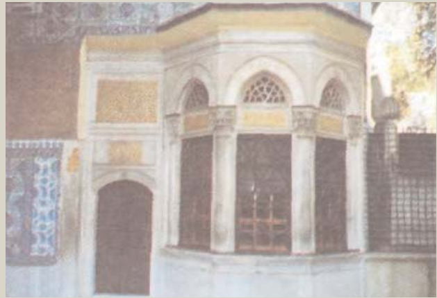
■ Sultan I. Ahmet Sebili

Kaynak: (Recep Akakuş, Eyyüb Sultan S: 112-124-244) (İ. Kumbaracılar, İst. Sebilleri S: 17) (E. Çelei, Danişman Ter. 2/98) (Hadika, 1/44 Akbyık Mes. Mustafa Ağa) (Mimar N. Emre, Türk Mimarları, Arkitekt 1937 Sayı; 1 S: 12) (Z. Nayıp, Sultan Ahmet Külliyesi S: 3944)